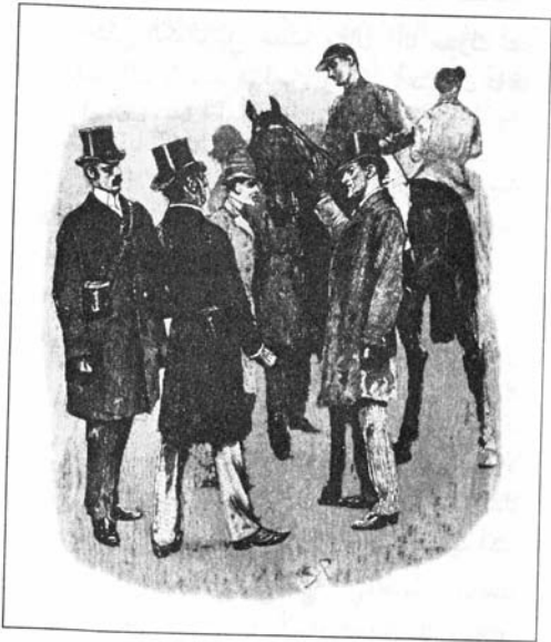
رسم سندي باجيت ١٨٩٢

بعضها من بعض، وفي منتصف الطريق ظهر الحصان التابع لحظائِر مابلتون في المقدمة، ولكن قبل أن تصل إلينا على أية حال قلّ جهد ديسبورو في حين تقدّم حصان الكولونيل فجأةً وعبر نقطة النهاية متقدماً على منافسه بست مسافات، في حين حلّ إيريس حصان الدوق بالمورال في المركز الثالث بشكل سيّئ.