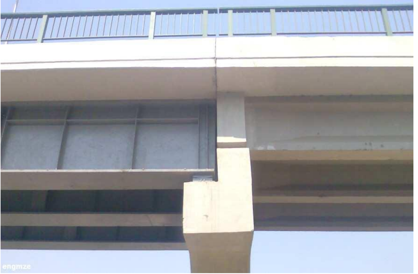
وهذه ركيزة متحركة على الكوبرى المعدنى تحمل قوة افقية وراسية