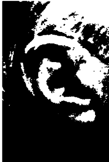
٨ - الأذن الصغيرة