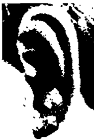
٥٥- فولفغانغ شتوبيل

أذن متوسطة الحجم، قوية وحسنة البنية، تدل على شخصية رزينة، غير انفعالية، ذات تصميم، قوية الإرادة، ذات روح مواجهة لا تخاف.