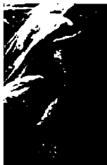
٧٤ - شتيفي غراف