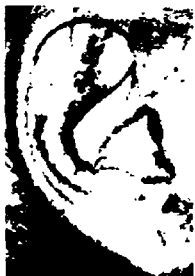
٢١ - ليونارد بيرنشتاين موسيقيار أمريكي مشهور عالمياً

أذن كبيرة حسنة التركيب في جميع أقسامها بتقسيم ثلاثي جميل الشكل وتضيق مناسب نحو الأسفل، كل ذلك يشير إلى إنسان صاحب خيال، وقادر على الانفعال، غزير الأفكار ومبدع.