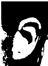
٧٠ - ستيفان ايدبرغ