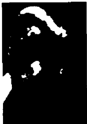
٨٠ - أذن أحد أبطال العالم في الملاكمة