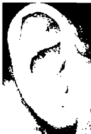
٧٧ - بيته سامبراس

أذن متوسطة الحجم بتراكيب جميلة وتقسيم ثلاثي جميل، تدل على الذكاء، وبالتالي على نشاط غزير الفكر (التس).