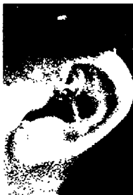
٧٦- جينيفر كابريراتي

جينيفر كابريراتي لها أذن صغيرة وسميكة جداً، ذات إطار بارز بشكل غير عادي، تدل على حيوية زائدة وقوية الاستجابة.