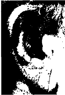
٥- الأذن الكبيرة