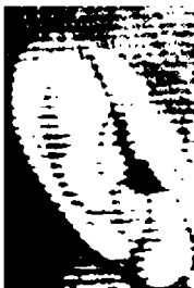
٦٥- أذن متعصب نشيط جداً محب للمغامرة وللحياة

أذن قوية وكبيرة ذات إطار خارجي قوي ومستطيل، تدل على حيوية وقوة إرادة.