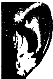
٢٦- توماس مان كاتب ألماني