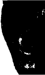
٣٧- فرانسوا ميتران الرئيس الفرنسي السابق

إذن كبيرة ذات تقسيم ثلاثي مدهش مع بروز قوي للقسم الأعلى من الأذن، يدل على إنسان غني بالأفكار، واسع الخيال، مرهف الحس، وشديد الذكاء. الإطار الخارجي ضيق، لكن بمعالم جيدة وتشكيل ثنيات ومسار عمودي في القسمين الأوسط والأسفل، يدل على إنسان في منتهى الحساسية، معجب بنفسه وعنيد جداً ذي حس اجتماعي قوي. الإطار الداخلي قوي وجميل التقاطيع، يدل على وضوح التفكير وموهبة الاستيعاب الجيد.