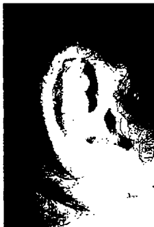
٩- الأذن الصغيرة ١٠- الأذن الصغيرة