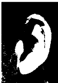
٦٩ - ايفان ليندل