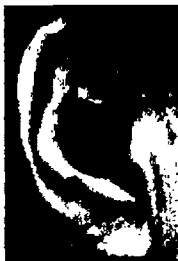
٢٧- سيمون دو بوفوار كاتبة فرنسية

أذن كبيرة جداً تدل عند النساء على قلة الحس الأنثوي العاطفي، ولكن في الوقت نفسه على غزارة الخيال والطاقة الهائلة.