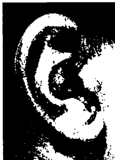
الأذن عند الرجل كبيرة

كبيرة، وهذا بقية من الاستعداد المتزايد للنزال. وفيما عدا ذلك فإن التقييم الذي سبق الحديث عنه بالنسبة لأذان الرجال، ينطبق أيضاً على أذان النساء.