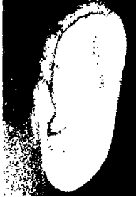
٥٨- صدام حسن ديكتاتور العراق السابق

أذن اهليلجية، بيضاوية، بلا ملامح محددة، تدل على شخصية لا ملامح لها وغير سوية، وعلى القسوة.