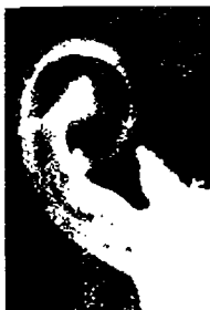
١٨ - أذن نسائية