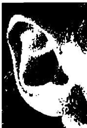
٧٨ - ماتس فيلاندر