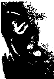
١٧- فيلهام كيميف عازف بيانو ألماني