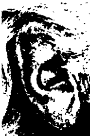
b1٩ - كورد يورغنر ممثّل عالمي مشهور