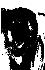
٧٢ - مارتينا ناهراتيلوفا