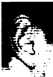
٣٤- غاري كاسياروف