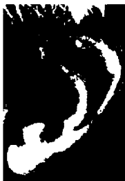
٣٩- ريشارد فون فايتسزيكر رئيس سابق لألمانيا الاتحادية

أذن كبيرة ذات تركيب جميل جداً مع تقسيم ثلاثي رائع، تدل على شخصية قوية الحماسة، غنية بالأفكار، ذكية ومتقفة.