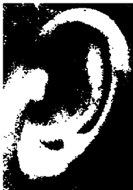
٤٦- مخائيل غورباتشوف رئيس الاتحاد السوفيتي السابق

أذن متوسطة الحجم جميلة التركيب، تدل على سيطرة المنطق والذكاء .