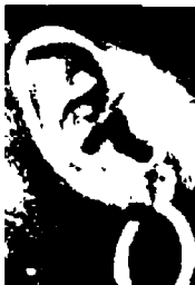
٧٩ - سيرينا وليامز بطلة أمريكية في التنس

سيرينا وليامز واحدة من أفضل بطلات التنس وأكثرهن موهبة، تقدم لنا أذنًا نقرأ منها الكثير: