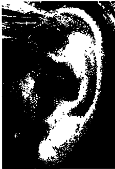
٤- الأذن الكبيرة