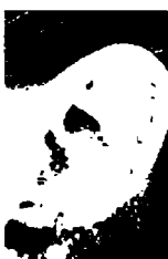
٧٣ - مارتينا هينغيس