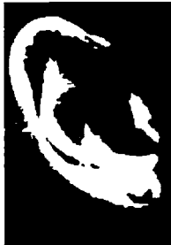
٧٥- مونيك سيلييس

الإطار الخارجي سميك جداً، بارز ومستطيل، يدل على انفعالات قوية الاستجابة وحيوية، وعلى التصميم والعناد.