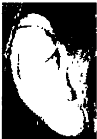
a 56 - أنجيلا ميركل

أذن كبيرة ذات إطار قوي تدل على الديناميكية والخيال وقوة التصور.