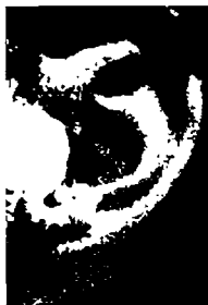
٧١ - بوريس بيكر