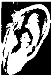
٤٠ - جورج بوش الأب رئيس سابق للولايات المتحدة