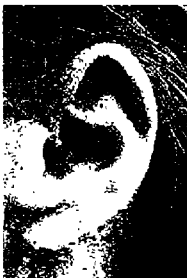
١٩ a - رومي شنايدر ممثلة عالمية مشهورة