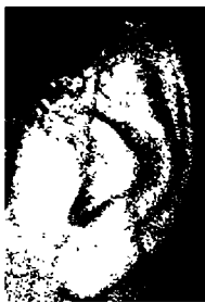
١٦ - ناتان ميلشتاين عقبري الكمان الأمريكي