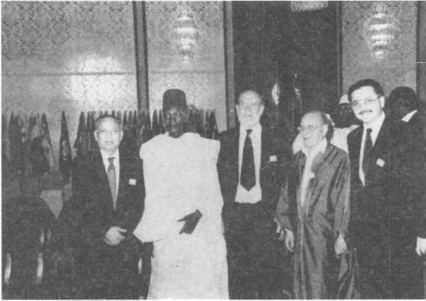
صورة جماعية للأمناء العامين لمنظمة المؤتمر الإسلامي، من اليسار إلى اليمين: شريف الدين بيرزاده (باكستان) ١٩٨٥-١٩٨٨م، أحمدو كريم جاي (السنغال) ١٩٧٥-١٩٧٩م، حسن التهامي (مصر) ١٩٧٤-١٩٧٥م، الحبيب الشطي (تونس) ١٩٧٩-١٩٨٤م، والبروفيسور أكمل الدين إحسان أوغلي (تركيا) ٢٠٠٥م- الوقت الحاضر.