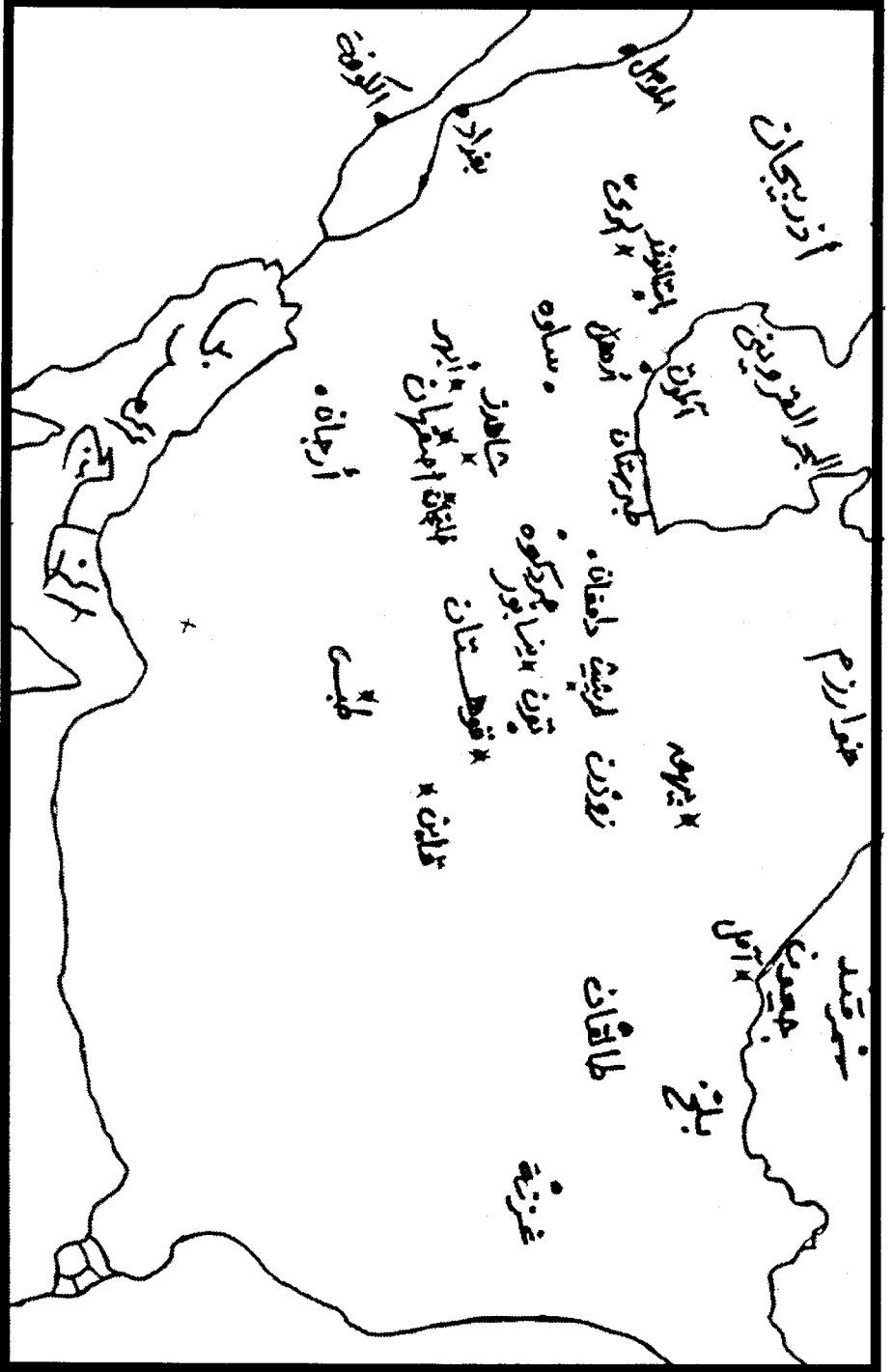
خريطة تبين مناطق نفوذ الحركة النزارية في بلاد فارس