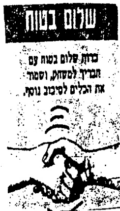
صورة رقم (٤)