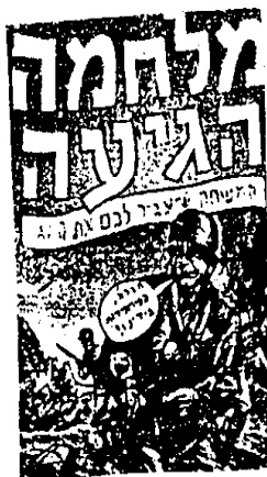
صورة رقم (٥)