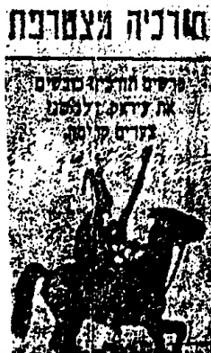
صورة رقم (٦)