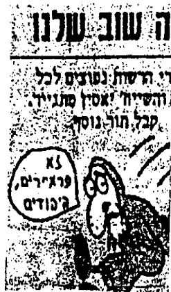
صورة رقم (٦)