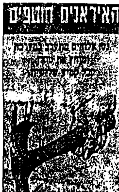
صورة رقم (٥)