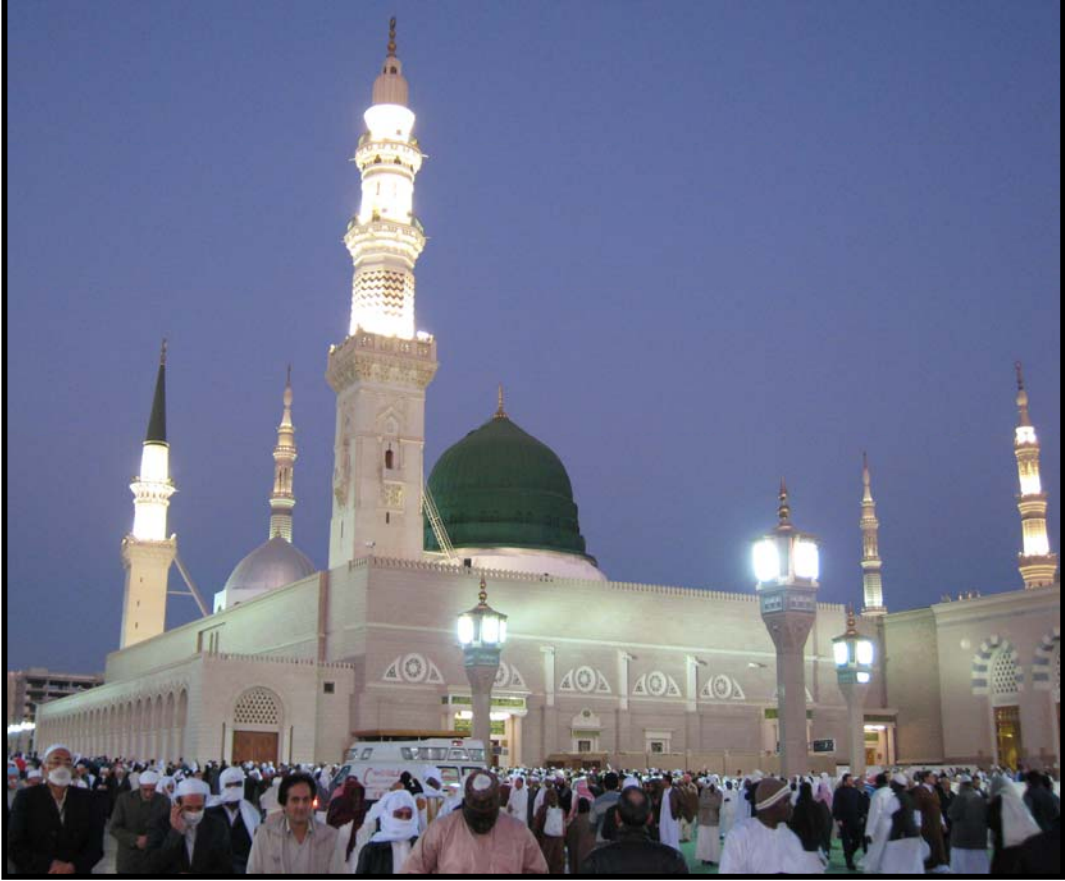
المسجد النبوي بالمدينة المنورة