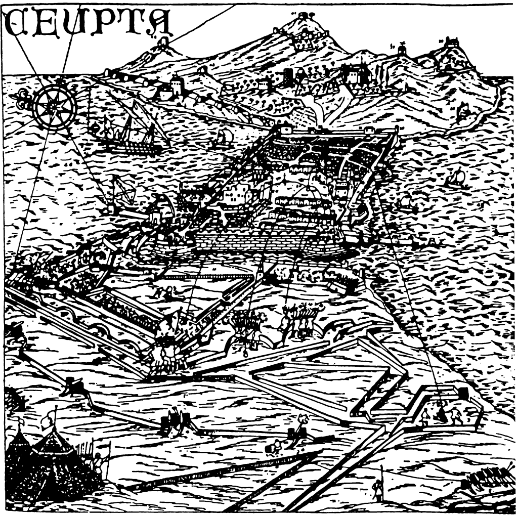
سبتة كما تبدو من الجانب الغربي من البرزخ (من مصدر برتغالي - القرن السابع عشر)