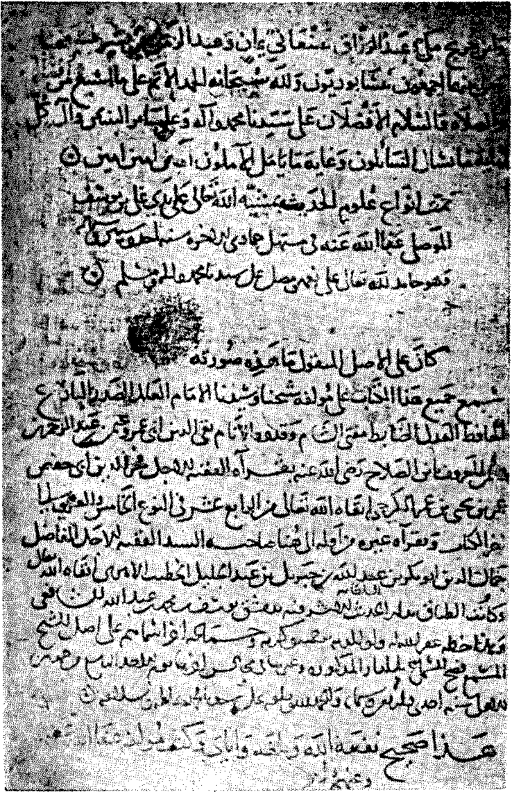
الصفحة الأخيرة من نسخة الموصل (ص) وعليها توقيعه بتاريخ الفراغ من نسخها سنة ٦٦١ هـ وبعد، نقلاً عن أصل نسخته، سماع الكتاب بالإسناد المتصل إلى ابن الصلاح، قراءة عليه في سنة ٦٤١ هـ، ثم توقيع ابن الصلاح بتصحيح السماع