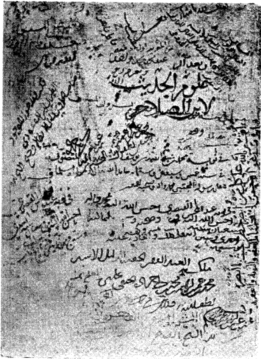
وجه نسخة الموصلي (ص) رقم ١ مصطلح حديث، وعليها توقيعات من تملكوها ومن وقعت في نوبتهم وأقدم تاريخ عليها: سنة إحدى وستين وستائة، تاريخ نسخها