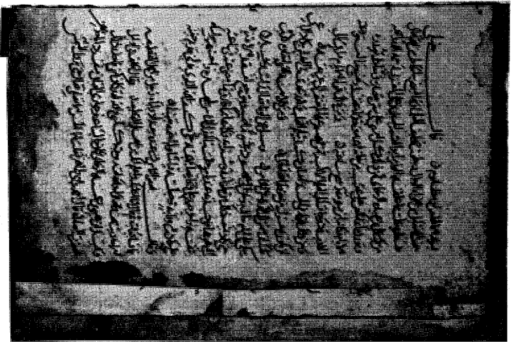
Paris MS. 787 - Fol. 263 b and its continuation 19 a.