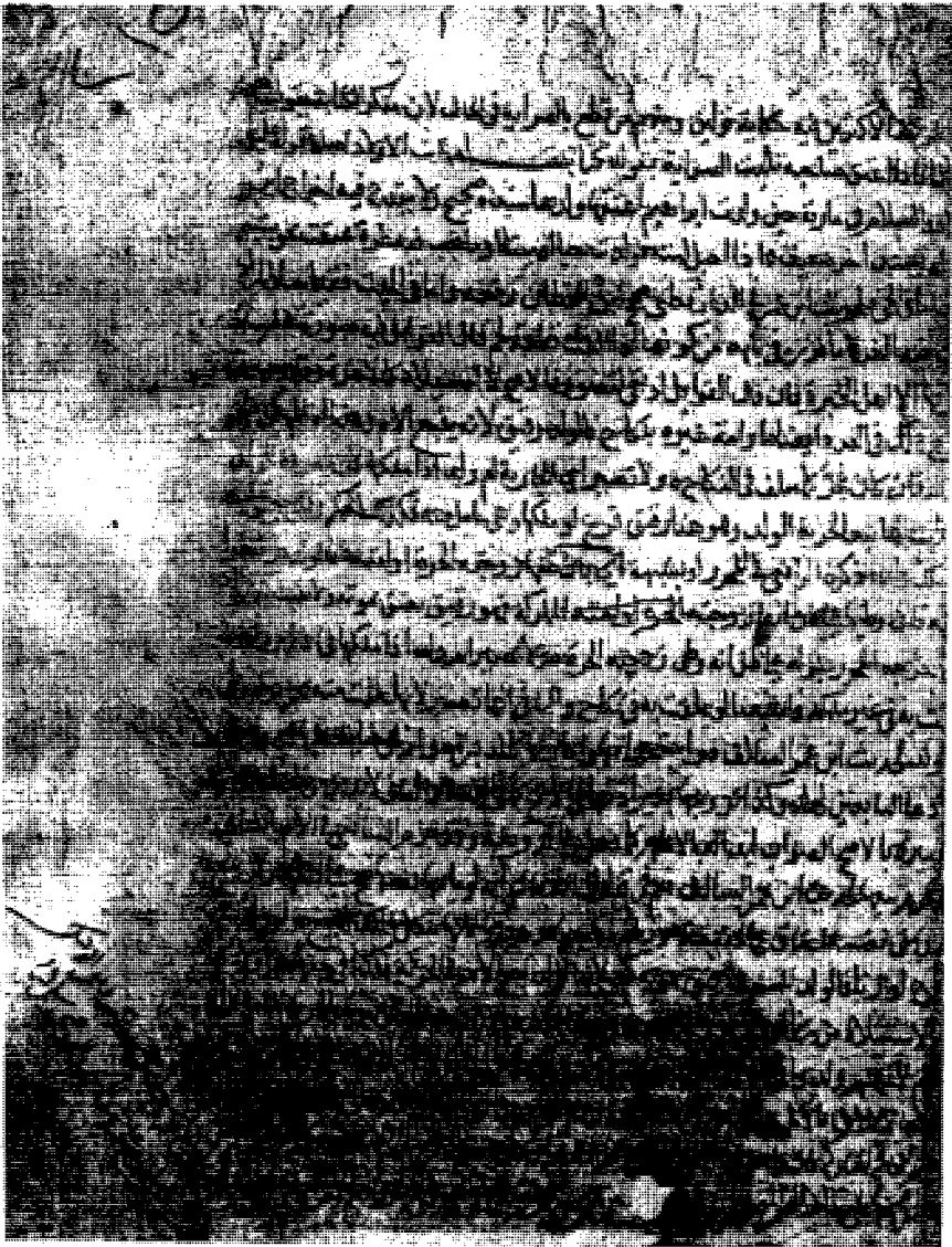
الصفحة الأخيرة من النسخة (٢) - الجزء الثاني رقم المخطوطة ٨/٦٥ مدرسة الحاج زكر - الموصل