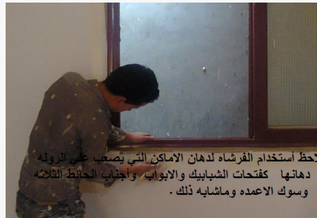
لاحظ أستخدام الفرشاه لدهان الاماكن التي يصعب على الروله دهانها كفتحات الشبابيك والابواب وأجناب الحائط الثلاثه وسوك الاعمه وماشابه ذلك .

وأسعارها الجالون 7 كيلو حوالي 70 جنيه . وأسعار الجالون اللامع 3.5 كيلو تقريبا 100 جنيه ويفرد حوالي 8 متر مربع