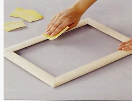
تنظيف الخشب بورق صنفرة جاف