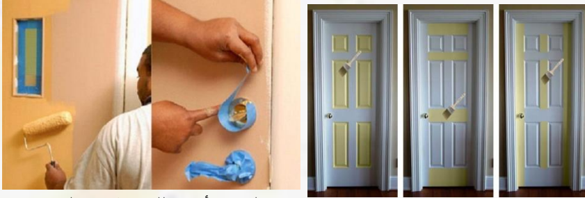
تغليف الأوكر للحماية من الدهان