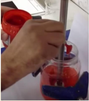
بعد إضافة الملون على المذيب

3- ثم تضاف مواد كيميائية رابطة للحصول على المنتج النهائي