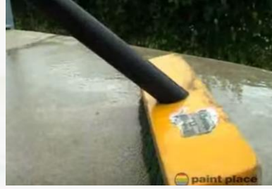
استخدام فرشاة الصنفرة لتنعيم السطح