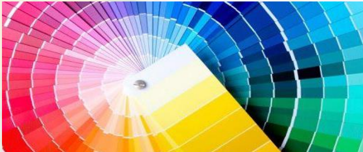
هذه الصورة لتوضيح أكثر عن قائمه الالوان ( كرتله الالوان )

وتكون في عبوات بستلات أوزان 9 لتر وتخفف بالمياة وأسعارها حوالي الكيماتون 245 جنيه للبيستله ،نصف لامع وزن 9 كيلو تقرد حوالي 95 الي 100 متر، وساييس 2000 نصف لامع سعره 225 جنيه وتضاف إليها علب ألوان مائي سكيب وغيرها لتعطي اللون المطلوب .سعر العلبه 3 جنيهات