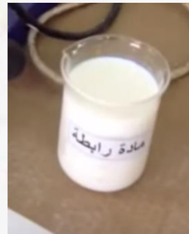
مواد كيميائية رابطة