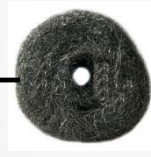
طلاء الأسطح المعدنية