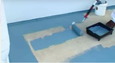
دهان السطح الخرساني