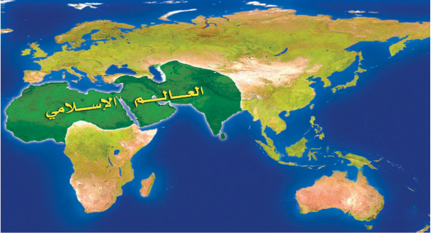
خريطة (1) : العالم الإسلامي في أوائل القرن السابع الهجري

المساحات الإسلامية في هذا الوقت كانت تقترب من نصف مساحات الأراضي المعمورة في الدنيا.. كانت حدود البلاد الإسلامية تبدأ من غرب الصين وتمتد عبر آسيا وأفريقيا لتصل إلى غرب أوروبا حيث بلاد الأندلس.. (انظر الخريطة رقم 1).