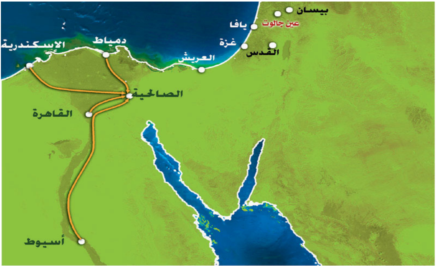
خريطة (١٨) : جمع الجيوش الإسلامية في الصالحية

وهي منطقة صحراوية واسعة تستوعب الفرق العسكرية المختلفة، وكانت نقطة انطلاق للجيوش المصرية المتجهة إلى الشرق..