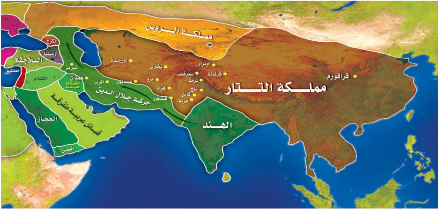
خريطة (٧) : ظهور حركة ( جلال الدين بن خوارزم ) سنة ٦٢٢هـ

وكانت حروبه هو والخوارزمية الذين معه حروباً شرسة مفسدة، مع أن البلاد المغنومة كلها بلاد إسلامية..! فكان يفعل بهم الأفاعيل من قتل وسبي ونهب وتخريب.. وكأنه تعلم من حروبه مع التتار كيف يقسو قلبه بدلاً من أن يتعلم كيف يرحم الذين عذبوا منذ شهور وسنوات على أيدي التتار.. ثم بسط جلال الدين سيطرته على مملكة الكرج النصرانية بعد أن أوقع بهم هزيمة فادحة، واصطاح مع أخيه غياث الدين صلحاً مؤقتاً، وأدخله في جيشه، ولكن كان كل واحد منهما على حذر من الآخر.. وبذلك بلغ سلطان جلال الدين من جنوب فارس إلى الشمال الغربي لبحر قزوين، وهي وإن كانت منطقة كبيرة إلا أنها مليئة بالقلقل والاضطرابات، بالإضافة إلى العداءات التي أورتها جلال الدين قلوب كل الأمراء في الأقاليم المحيطة بسلطانه بما فيهم الخليفة العباسي الناصر لدين الله.. وسياسة العداوات والمكائد والاضطرابات هي السياسة التي ورثها جلال الدين عن أبيه محمد بن خوارزم وتحدثنا عنها من قبل.. ولم تأت إلا بالويلات على الأمة.. وليت المسلمون يفقهون..