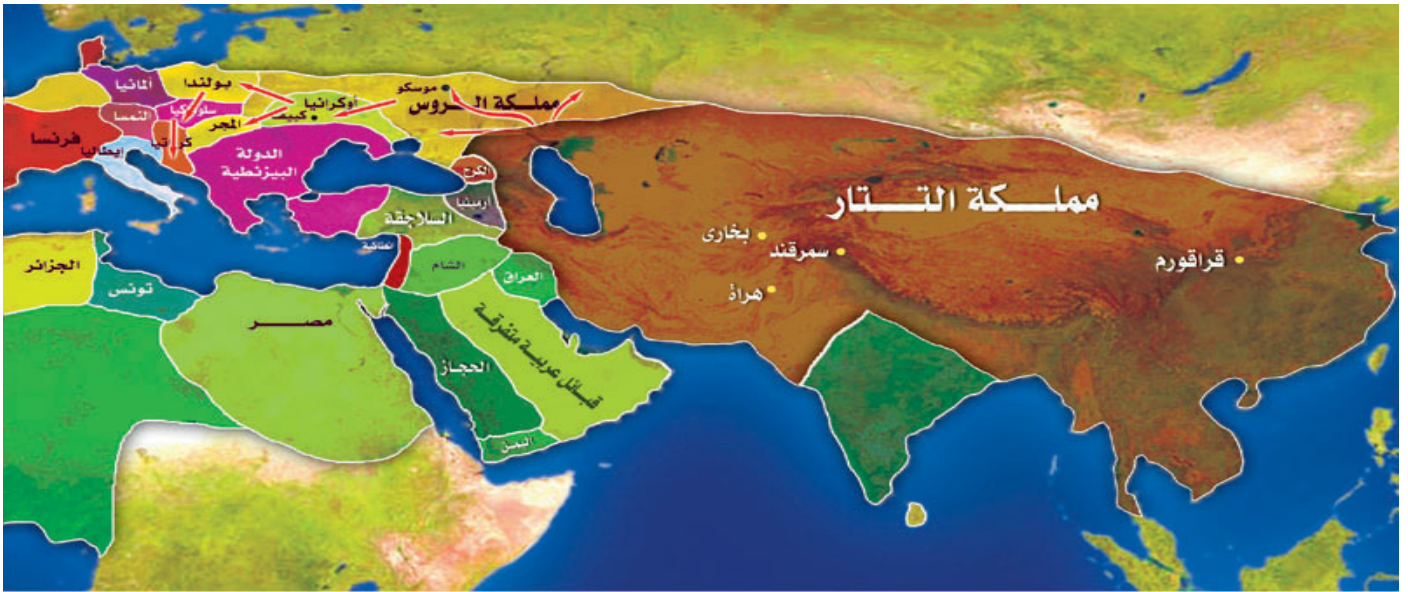
خريطة (١٠) : غزو التتار لشرق أوروبا سنة ٦٣٩ هـ

ثم تدفقت الجيوش التتارية إلى دولة "كرواتيا" فاجتاحتها!! وبذلك وصلت الجيوش التتارية إلى سواحل البحر الأدرياتي (وهو البحر الفاصل بين كرواتيا وإيطاليا)، وبذلك يكون التتار قد ضموا إلى أملاكهم نصف أوروبا تقريباً!!.. (انظر الخريطة رقم 10).