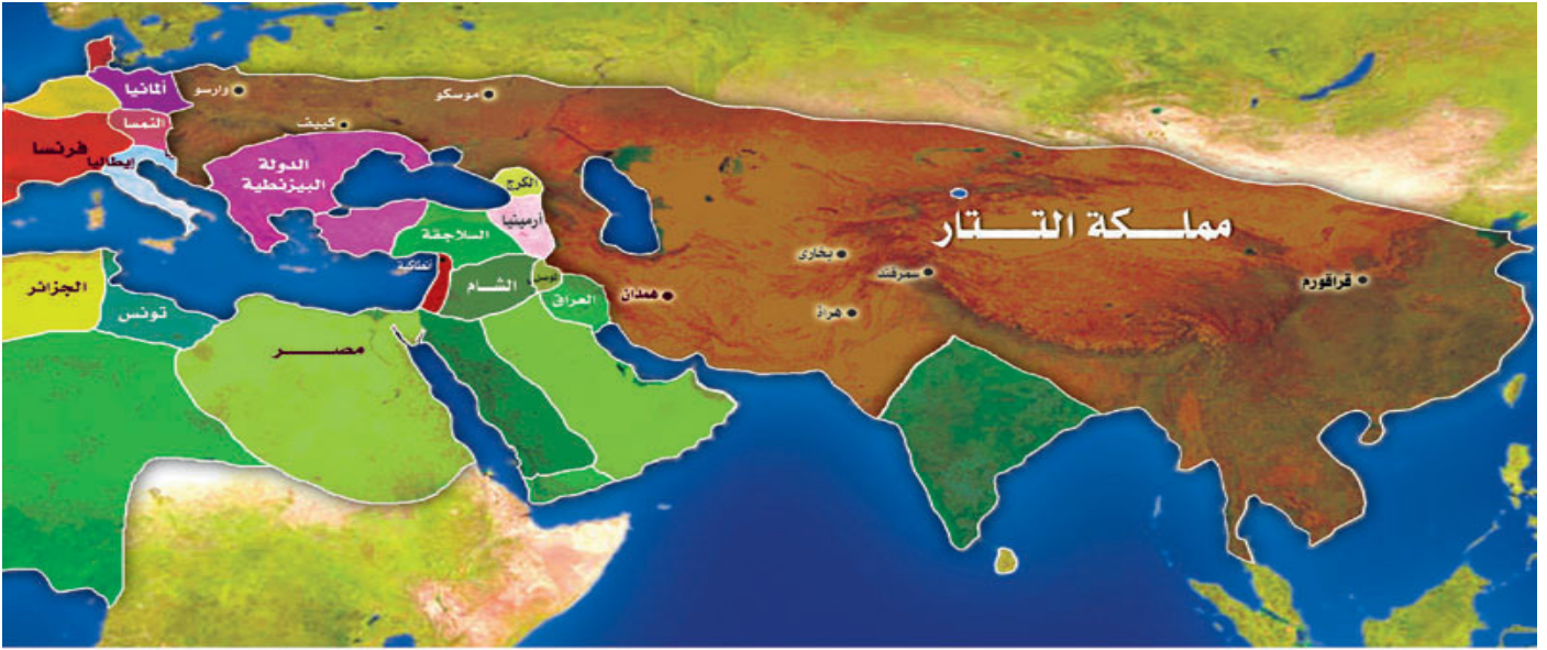
خريطة (١١) : مملكة التتار سنة ٦٣٩ هـ

- ثانياً: تولى قيادة التتار بعد "أوكيتاي" ابنه "كيوك بن أوكيتاي"، وقد كان لهذا الخاقان الجديد الرأي في تثبيت الأقدام في البلاد المفتوحة بدلاً من إضافة بلاد جديدة قد لا يقوى التتار على حفظ النظام فيها، والسيطرة على شعوبها وجيوشها، ومن ثم فقد توقفت الفتوحات التتارية في عهد هذا الخاقان، وإن ظل التتار يحافظون على أملاكهم الواسعة..