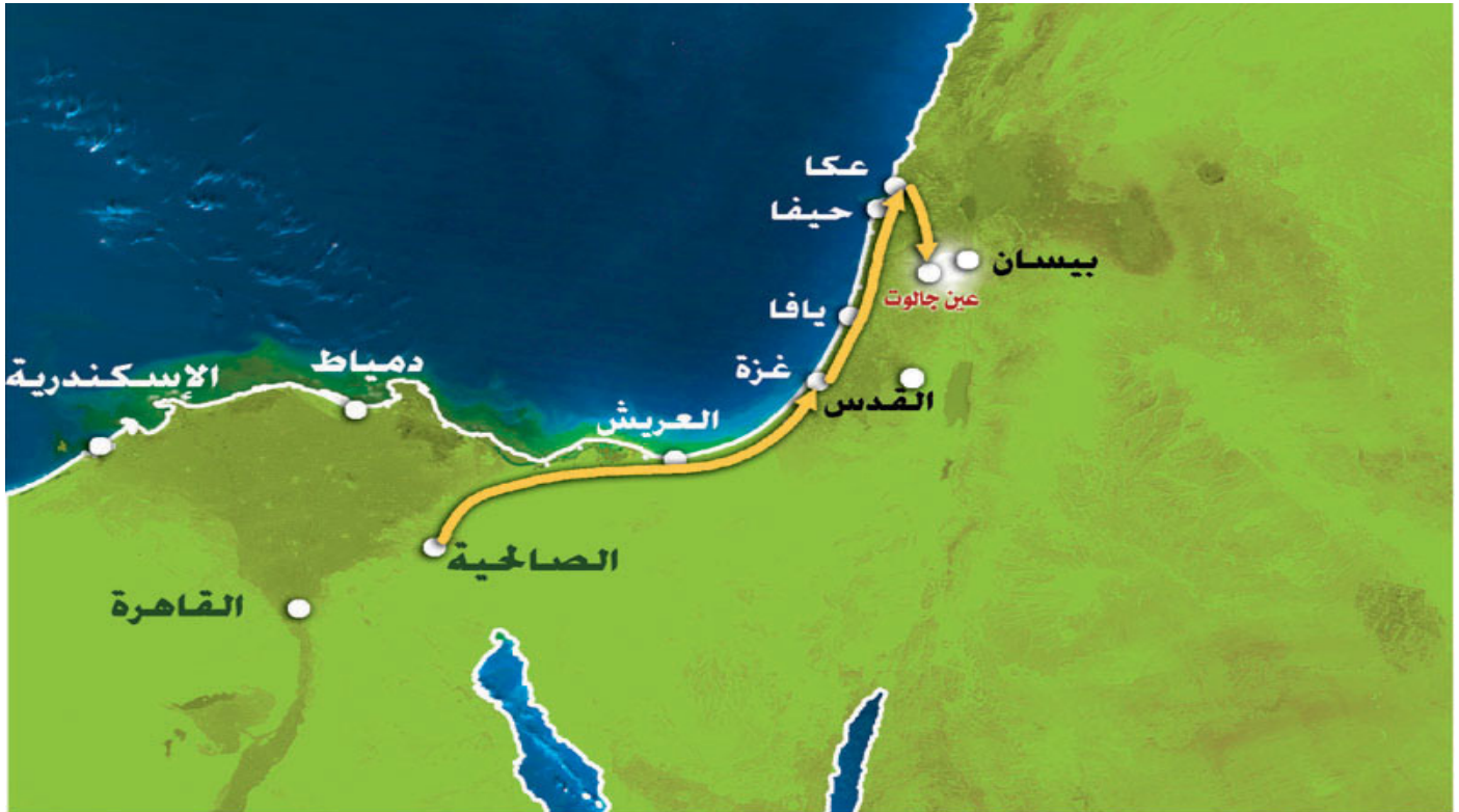
خريطة (١٩) : حركة الجيوش الإسلامية داخل فلسطين حتى "عين جالوت"

وهكذا اجتاز ركن الدين بيبرس الحدود المصرية في ٢٦ يوليو سنة ١٢٦٠ ميلادية، ودخل حدود فلسطين المباركة، وتبعه قطز بعد ذلك في سيره .. واجتازوا رفح وخان يونس ودير البلح واقتربوا جداً من غزة (انظر الخريطة رقم ١٩)..