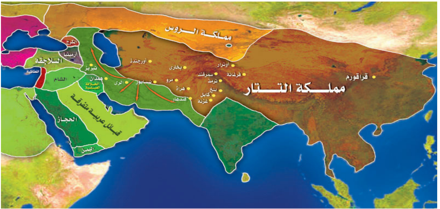
خريطة (٨) : غزو التتار لأقاليم باكستان و إيران و أذربيجان سنة ٦٢٩هـ

وبتلك الانتصارات التتارية - إلى جانب موت جلال الدين على النحو الذي مرّ بنا - اكتمل سقوط إقليم فارس كله في يد التتار باستثناء الشريط الغربي الضيق الذي تسيطر عليه طائفة الإسماعيلية الشيعية. (انظر الخريطة رقم 9).