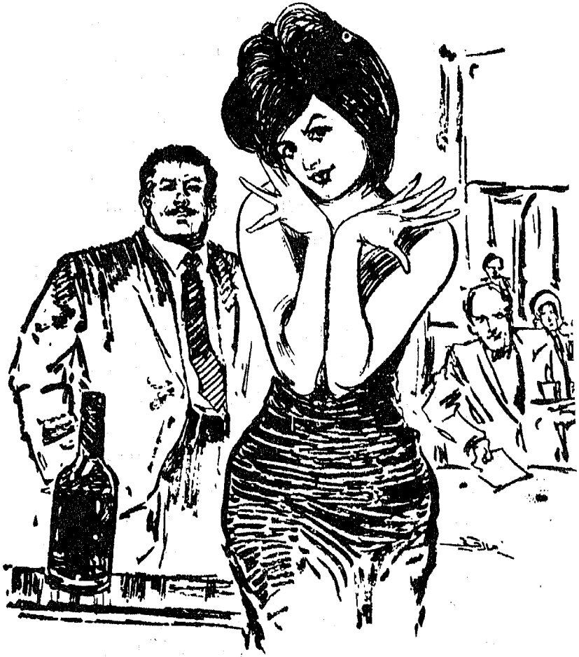
( كلما رأيتك أزداد شهوة )