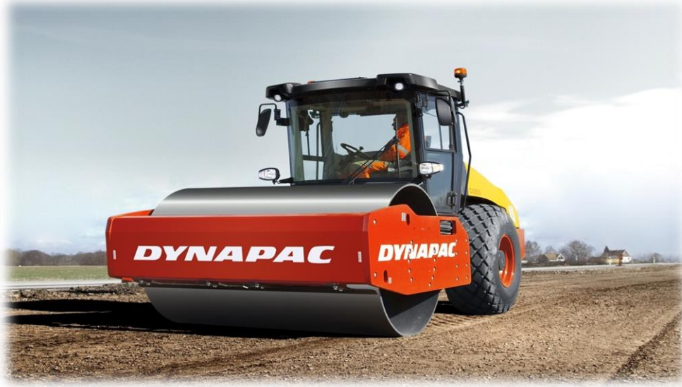
شكل 2.3 الدمك الموقعي للتربة