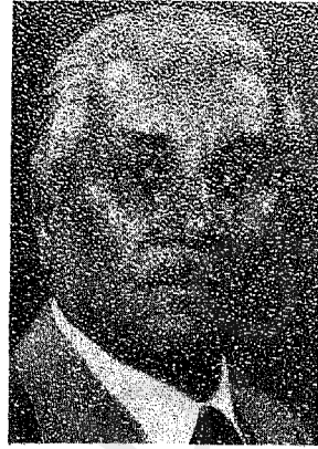
عبد الوهاب البياتي