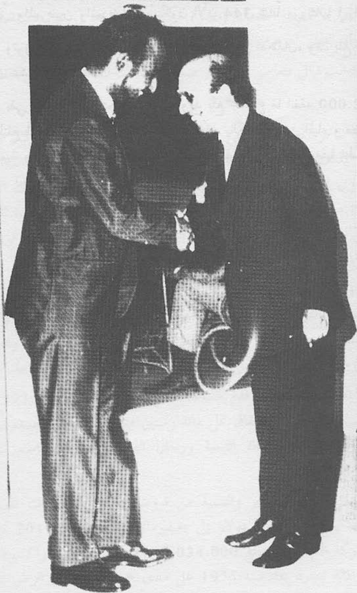
في احدى مقابلاتي مع السيد حمدي ولد مكناس وزير خارجية الجمهورية الاسلامية الموريتانية