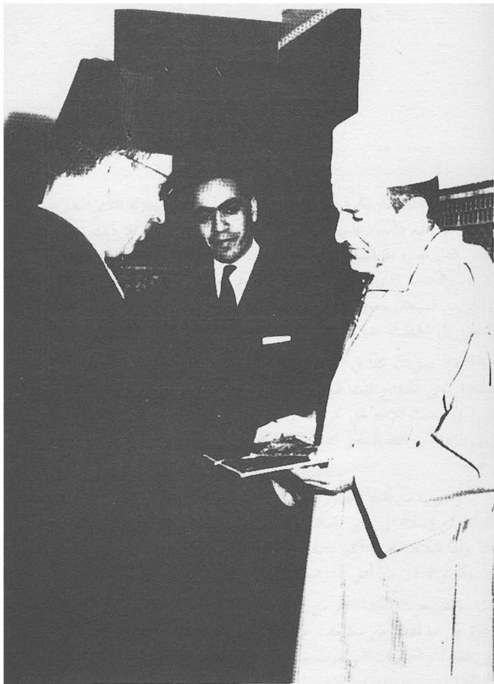
جلالة محمد الخامس رحمه الله يوم تعييني سفيراً في السنغال بمحضر الأستاذ محمد بوستة وزير العدل وكاتب الدولة في الشؤون الخارجية إذ ذاك