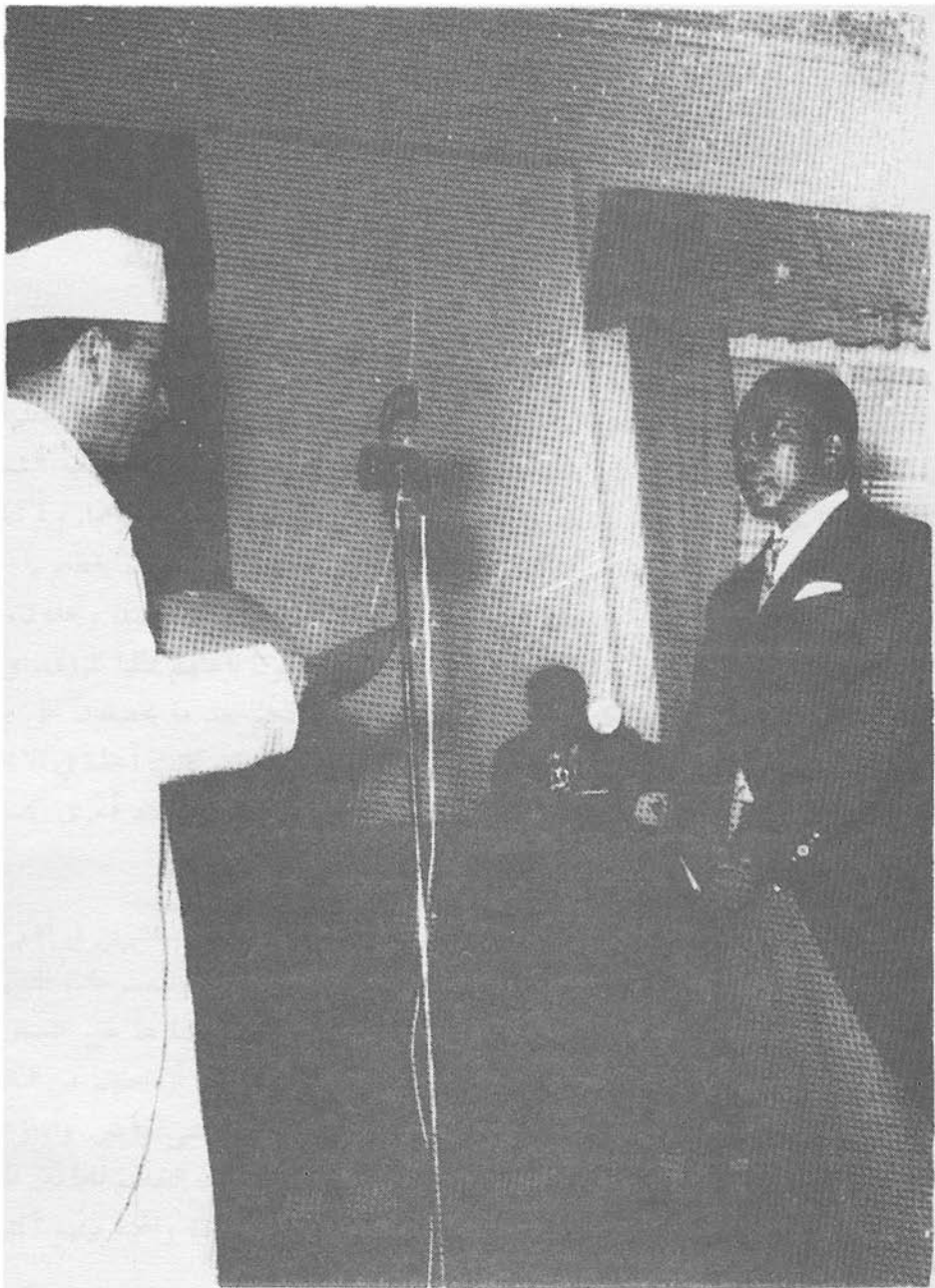
فخامة الرئيس ليوبولد سيدار سينغور رئيس جمهورية السينغال يوم قدمت أوراق اعتمادي سفيراً لجلالة محمد الخامس لدى فخامته