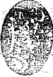
صورة الورقة الأولى من نسخة «ص»