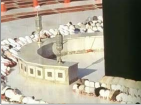
الحِجْر ( الحطيم )

ثمان مرات كان آخرها في عام ١٤٢٣ هـ في عهد خادم الحرمين الشريفين الملك فهد بن عبد العزيز آل سعود يرحمه الله، ومن عصمة الله أيضاً لهذا المقام وكذلك الحجر الأسود ان عصمهما من اتخاذهما اصناماً تعبد في الجاهلية، فلو كان كذلك ثم جاء الإسلام بتعظيمه لقال المنافقون أن الإسلام اقر إحترام بعض الاصنام، وتسن الصلاة خلفه بعد الطواف إن امكن وإن كان هناك إزدحام فيجوز صلاة ركعتي الطواف في أي مكان في المسجد الحرام، وحتى خارج الحرم كما صح ذلك عن فعل عمر بن الخطاب رضي الله عنه ، ومن السنة لصلاة ركعتي الطواف قراءة سورة الكافرون بعد الفاتحة في الركعة الأولى وقل هو الله احد (الأخلاص) في الثانية، وتجوز صلاة ركعتي الطواف حتى في اوقات النهي، وإن كان وقت النهي عن الصلاة قد اقترب على الإنتهاء وليس على الطائف مشقة فيمكن تأخير الركعتان حتى إنتهاء وقت النهي، ولا يصح التمسح به والتبرك ولا تقبيله لأن ذلك لم يرد عن رسول الله صلى الله عليه وسلم ولا عن صحابته رضوان الله عليهم اجمعين، ولا بأس بالنظر اليه.