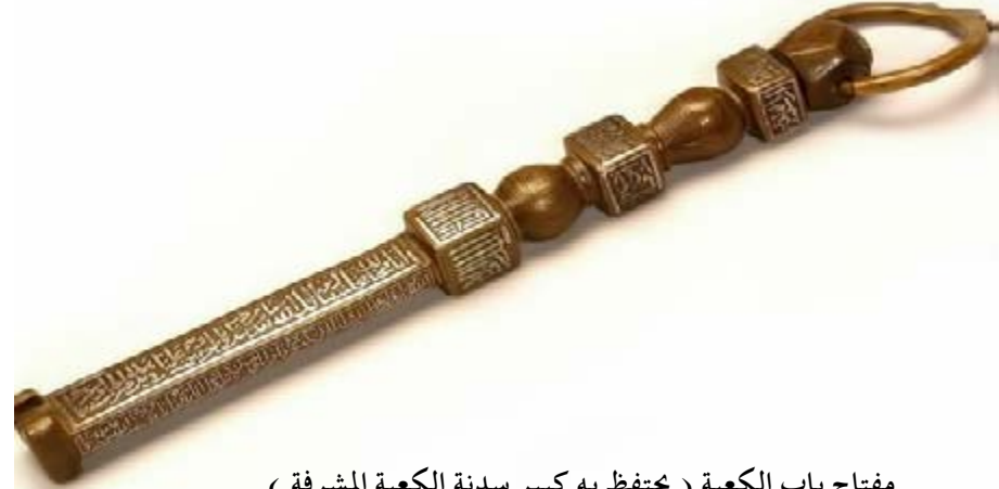
مفتاح باب الكعبة ( يحتفظ به كبير سدنة الكعبة المشرفة )

السدانة والحجابة بمعنى واحد وهي تولي خدمة البيت او الكعبة المشرفة وفتح الباب وإغلاقه, وقد كانت السدانة قبل قريش لقبيلة طسم وهي قبيلة من قوم عاد ، ثم وليتها خزاعة ، ثم وليها قصي فأعطاها لولده عبد الدار ، وأعطاها عبد الدار لولده عثمان وهكذا حتى وصلت لعثمان بن طلحة ثم الى ابن عمه شيبه, وهي في ابناء شيبه حتى الآن بأمر من الرسول ﷺ حين دفع اليهم مفتاح الكعبة في عام الفتح وقال ( خذوها يا بني أبي طلحة خالدة تالدة لاينزعها عنكم إلا ظالم ) وهذه العائلة معروفة هذه الأيام بأسم عائلة ( الشيببي ) ويحتفظون بمفتاح الكعبة المشرفة في بيت كبير السدنة, كما كان يتم تسليمهم ثوب الكعبة المشرفة القديم عند كسوة الكعبة بالثوب الجديد, ولكن يتم الإستعاضة عن ذلك هذه الأيام بمبالغ مالية يتم دفعها لآل الشيببي ، وتحتفظ الحكومة السعودية بالكسوة حيث يتم توزيع اجزاء منها على رؤساء الدول وزوارها .