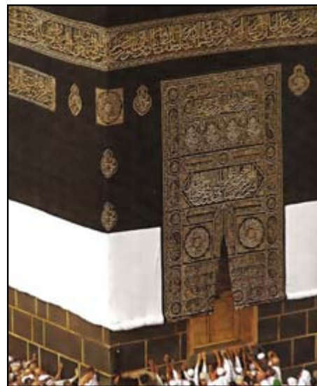
الملتزم (اعتاب الملك)

وهو مكان الالتزام من الكعبة والدعاء، ويقع ما بين الحجر الأسود وباب الكعبة ومقداره نحو مترين. والملاحظ ان ابراهيم عليه السلام اختار مكان باب الكعبة المشرفة قريباً من الحجر الاسود وليس في وسطها ليكون هذا المكان هو (الملتزم) ويسميه البعض (المتعوذ) والسنة وضع الصدر والوجه والذراعان والكفان عليه والدعاء بما شاء وفي أي وقت، وقد قال مجاهد: رأيت ابن عباس وهو يستعيذ ما بين الركن والباب، كما صح عن عبد الله بن عمر رضي الله عنهما انه الصق صدره ويديه وخده بالملتزم ثم قال: هكذا رأيت رسول الله ﷺ يفعل والوقوف بالملتزم صورة للعبد الذي ينطرح بين يدي مولاه الحي القيوم هارباً منه اليه. لائتذاً بحرمة، واقفاً على اعتاب بابيه. ويمكن الوقوف بالملتزم للحجاج او المعتمر او الزائر لبيت الله الحرام في أي وقت ولا علاقة لذلك بالنسك