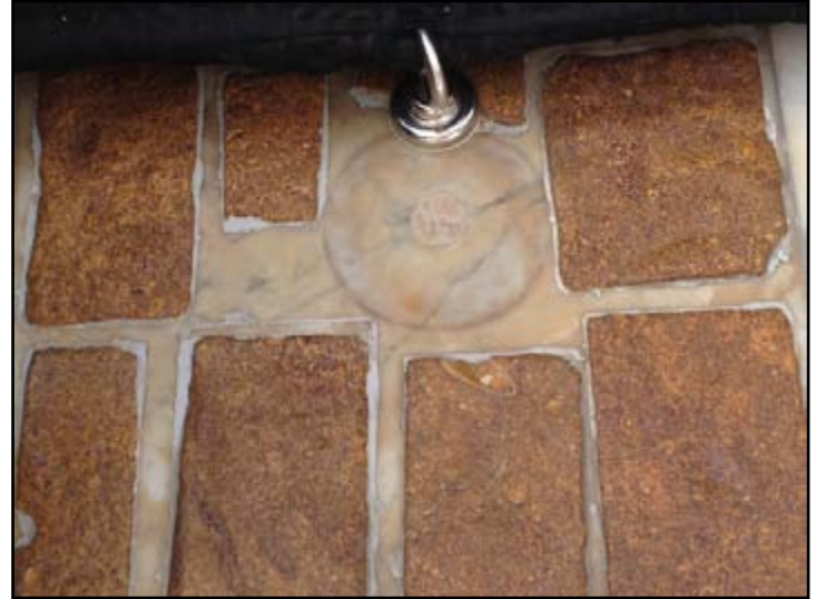
المعجن ( صورة للبلاطات الثمان بشاذروان الكعبة المشرفة )

هو حفرة صغيرة كانت لصق جدار الكعبة المشرفة من الجهة الشرقية بين باب الكعبة وركن الكعبة العراقي وطولها متران وعرضها ١١٢ سم وعمقها ٢٨ سم, يقال انها علامة موضع مقام ابراهيم عليه الصلاة والسلام , وهي ايضاً علامة مصلى الرسول ﷺ يوم فتح مكة بعد خروجه من الكعبة المشرفة, وهي مصلى جبريل عليه السلام , واما ما ذكره بعض المؤرخين من انها مكان عجن اسماعيل عليه السلام الطين لبناء البيت فهو مستبعد لكون البيت بني