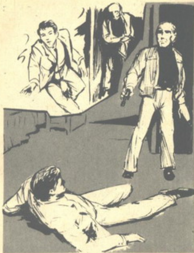
دفع أحدهم الباب بقوة ، فاصطدم بـ ( أدهم ) وألقاه أرضاً ..

على باب الغرفة .. أسرع يسحب مسدسه وهو يقترب من باب الغرفة ويقول :