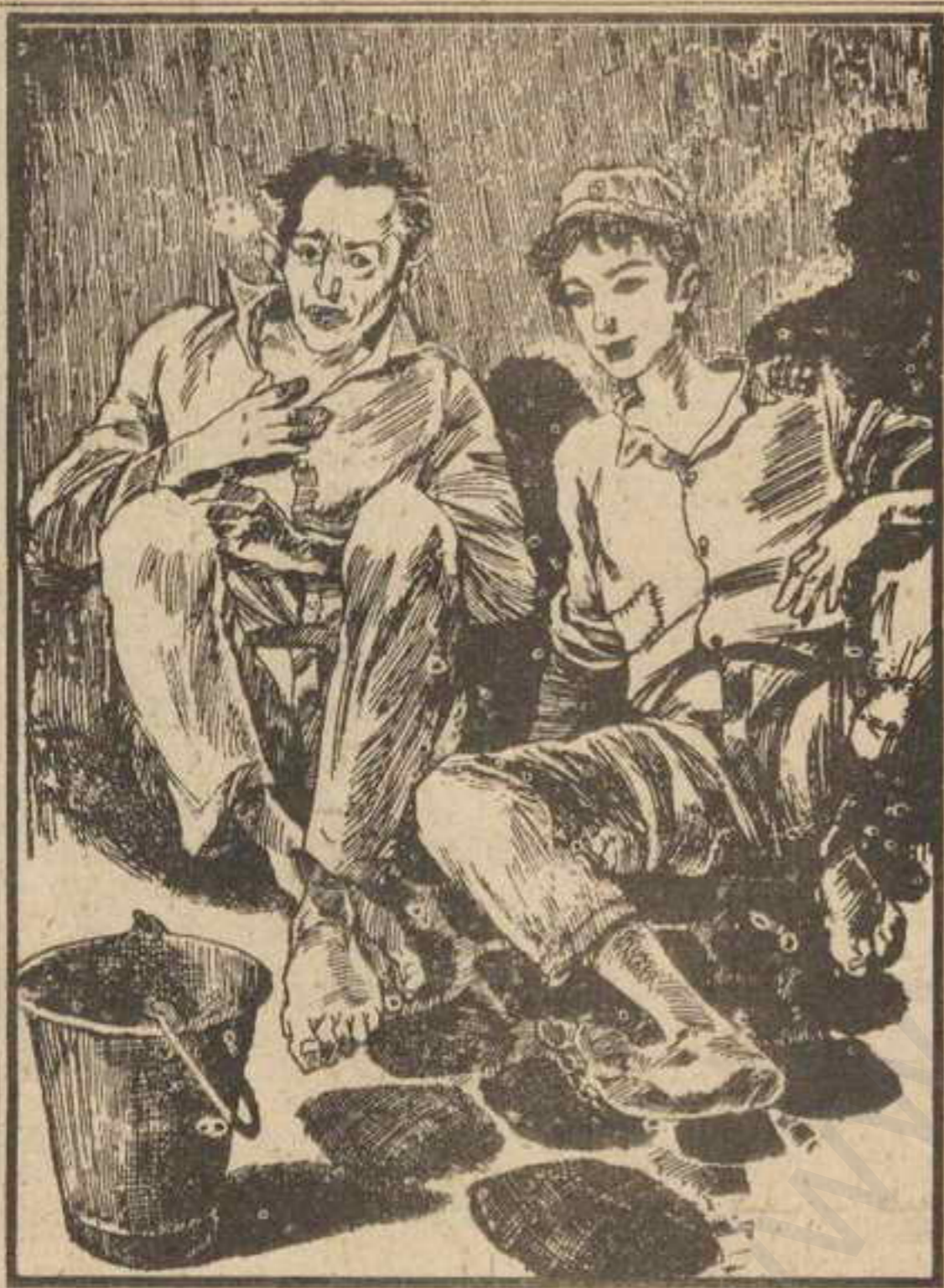
وجلس «عاطف» في التخشيبية وأخذ يستمع إلى حديث «طرزان»

أحس « عاطف » بقلبه يقع في قدميه ، كيف يستطيع البقاء في هذا المكان بضعة أيام ، وماذا سيفعل الأصدقاء