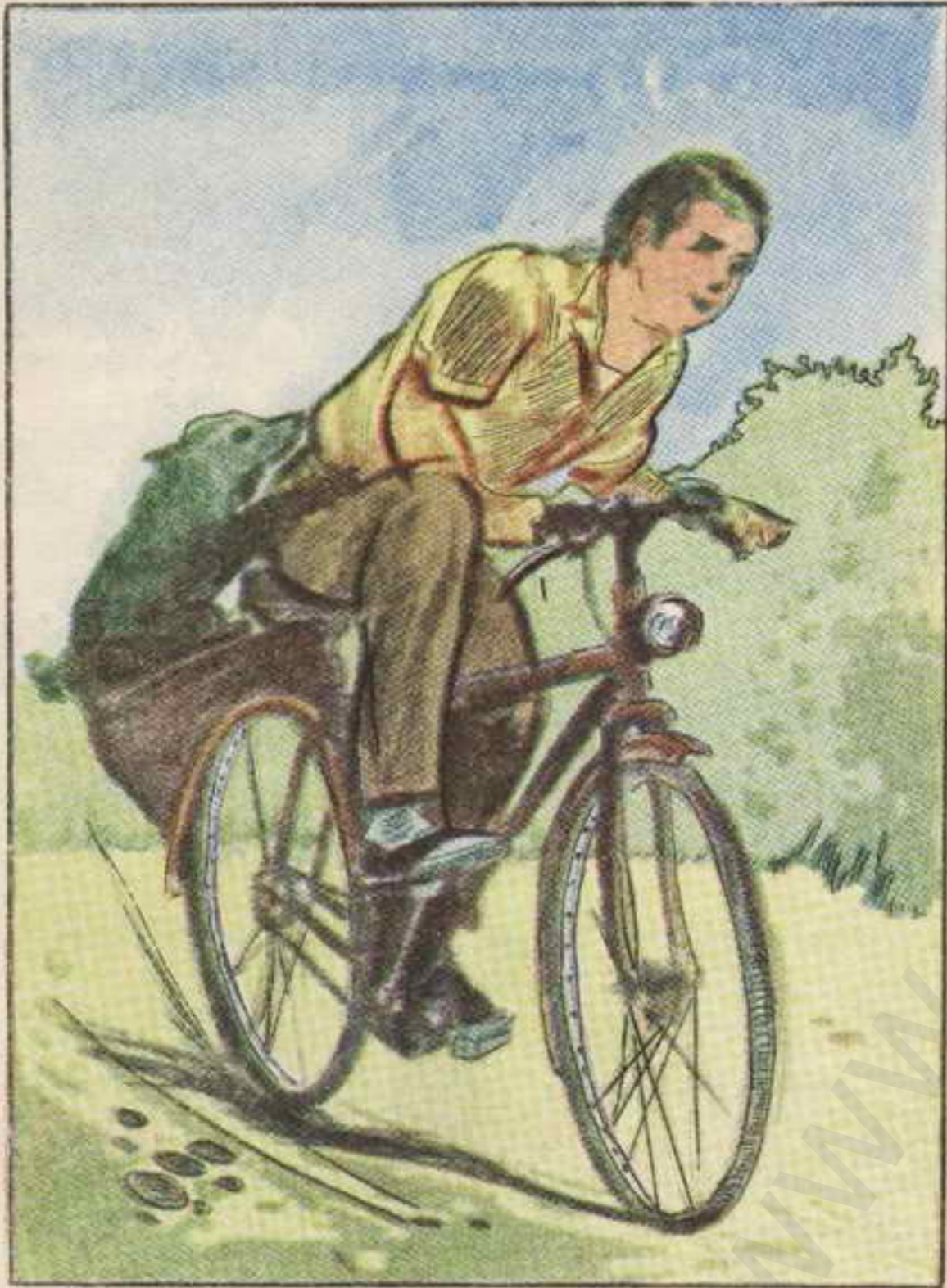
وركب « نختخ » دراجته وأخذ « زنجير » خلفه وانطلق في طريقه .

تذكر « عاطف » كلمة « بزرجى » التى كانت فى الرسالة ومعناها مخبر .. فقال : « لا أعرف .. ولكن لماذا يتبعنى بزرجى ؟ » .