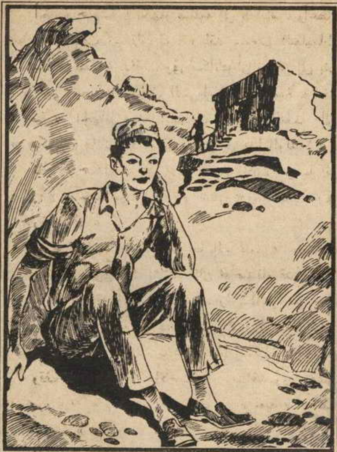
واتجه «لعبة» إلى صخور الجبل، وجلس «عاطف» وحيداً ينتظر

أخذ «حمكشة» الجهاز فسلمه إلى «لعبة» وأعطاه بضعة جنيهات ثم قال له : « لقد سمعت التعليمات وعليك أن تنفذها بدقة .. وفي إمكانك أن تسافر إلى بنها مثلا حتى تبعد عنا رجال الشرطة بمسافة بعيدة » أخذ «لعبة» الجهاز وبدأ ينصرف ولكنه التفت إلى «حمكشة» قائلاً : « وماذا ستفعل في هذا الولد ؟ » . نظر «حمكشة» إلى «عاطف» نظرة مرعبة ثم قال : « سأخذه معي إلى «أبو شنب» ونتخلص منه في المغارة هناك » .