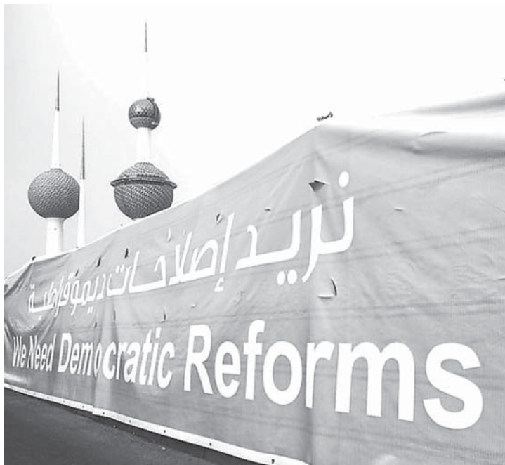
يريدون إصلاحات ديمقراطية!