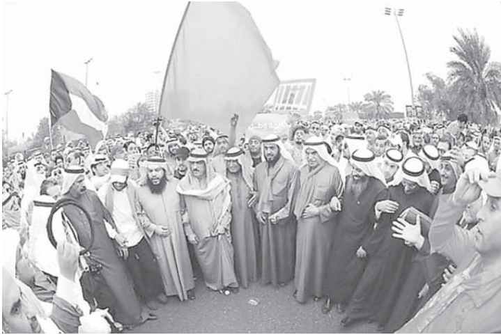
حشد للمعارضة في «ساحة الإرادة»