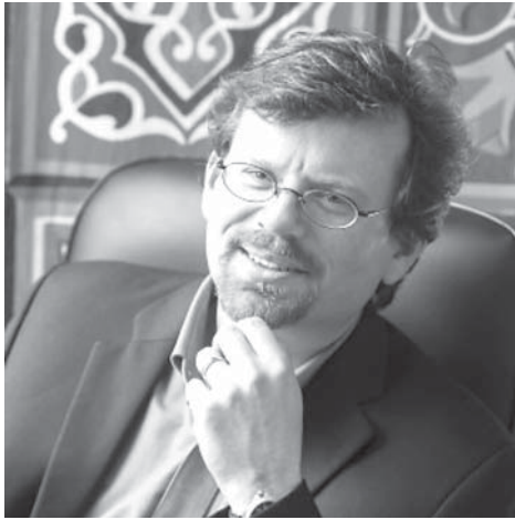
بروفيسور مايكل هيرب

(*) بقلم بروفيسور مايكل هيرب، 30 سبتمبر 2013، نشرة «موجز سياسي» (بوليسي بريف) منشورة على موقع «مشروع الديمقراطية في الشرق الأوسط» (POMED) وهي منظمة أميركية غير ربحية وغير حزبية مكرسة لدراسة كيفية تطوير الديمقراطيات في الشرق الأوسط، وكيف يمكن للولايات المتحدة تقديم أفضل دعم لهذه العملية. مايكل هيرب هو أستاذ مشارك في العلوم السياسية في جامعة ولاية جورجيا الأميركية في مدينة أتلانتا، وهو مؤلف كتاب «كل شيء في العائلة: الاستبداد والثورة والديمقراطية في ممالك الشرق الأوسط»، (ألباني، نيويورك: قسم النشر بجامعة ولاية نيويورك، 1999)، وهو مؤسس «قاعدة بيانات السياسة الكويتية». (العيسى)