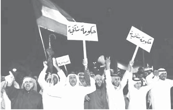
الحكومة المنتخبة: جوهر الصراع السياسي بالكويت