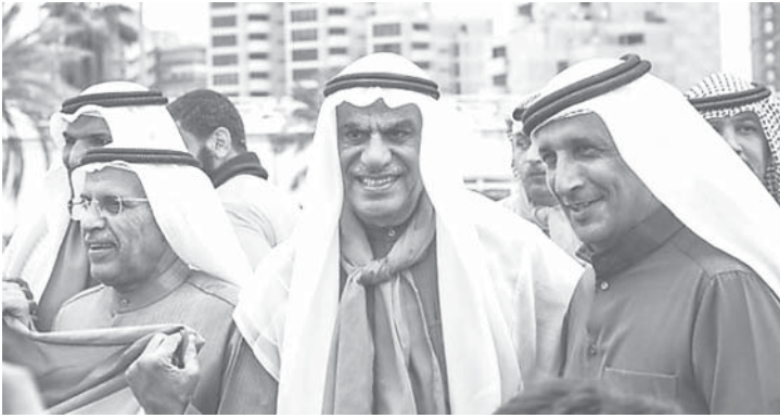
رئيس مجلس الأمة، أحمد السعدون، شارك في مسيرة «كرامة وطن»