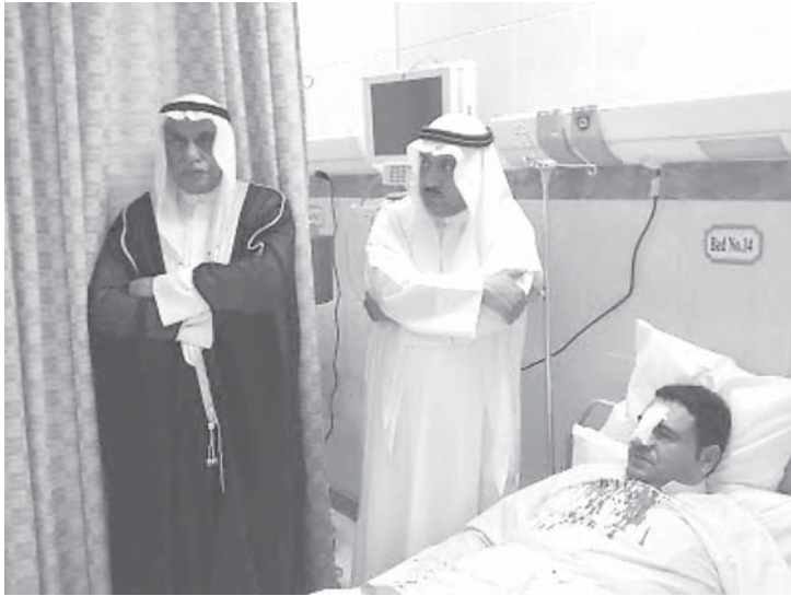
النائبان أحمد السعدون ومسلم البراك يزوران الصحفي زايد الزيد في المستشفى