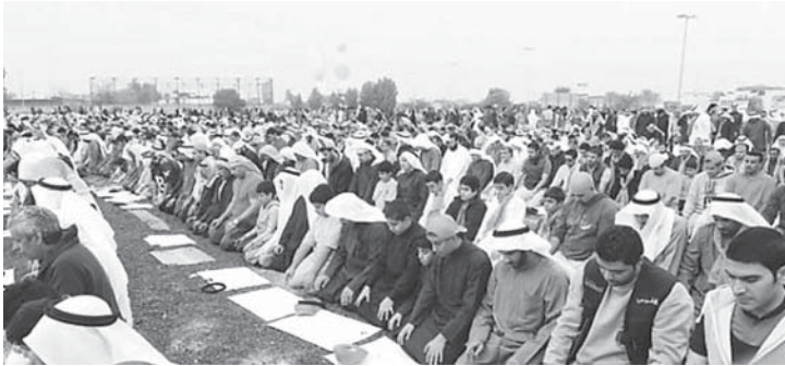
الجميع يصلي في «ساحة الإرادة»