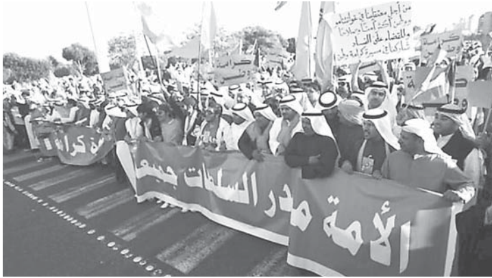
«الأمة مصدر السلطات»