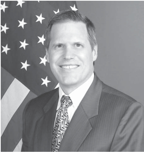
السفير الأميركي بالكويت، ماثيو تولر