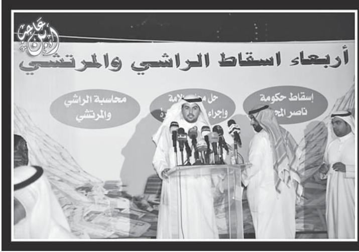
حملة ضد شراء الأصوات في الانتخابات