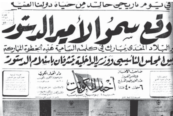
توقيع الدستور عام 1962