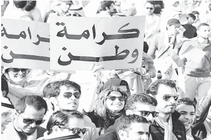
شباب الكويت .. شعلة الكرامة