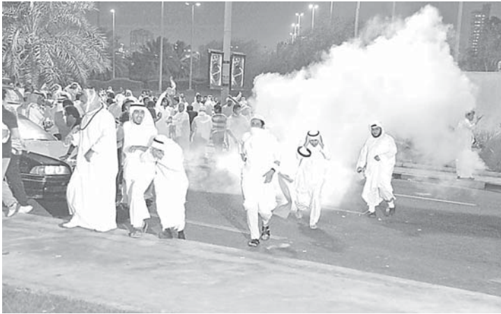
استعملت غازات مسيلة للدموع في محاولة لوقف وردع المحتجين