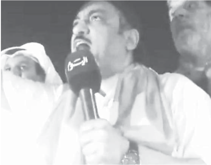
مسلم البراك يخطب في الجماهير