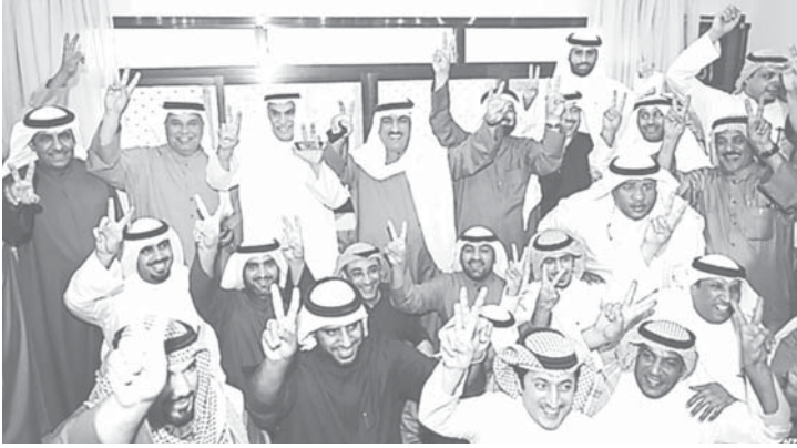
الرئيس السعدون والنائب البراك والمحامي الجاسم مع بعض شباب المعارضة يرفعون شارة «النصر»