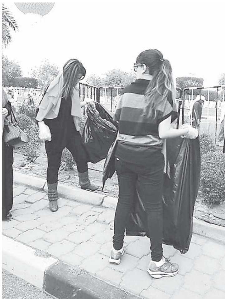
... النظافة من الإيمان