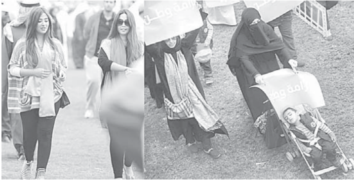
الأمهات والشابات شاركن في مسيرة «كرامة وطن»