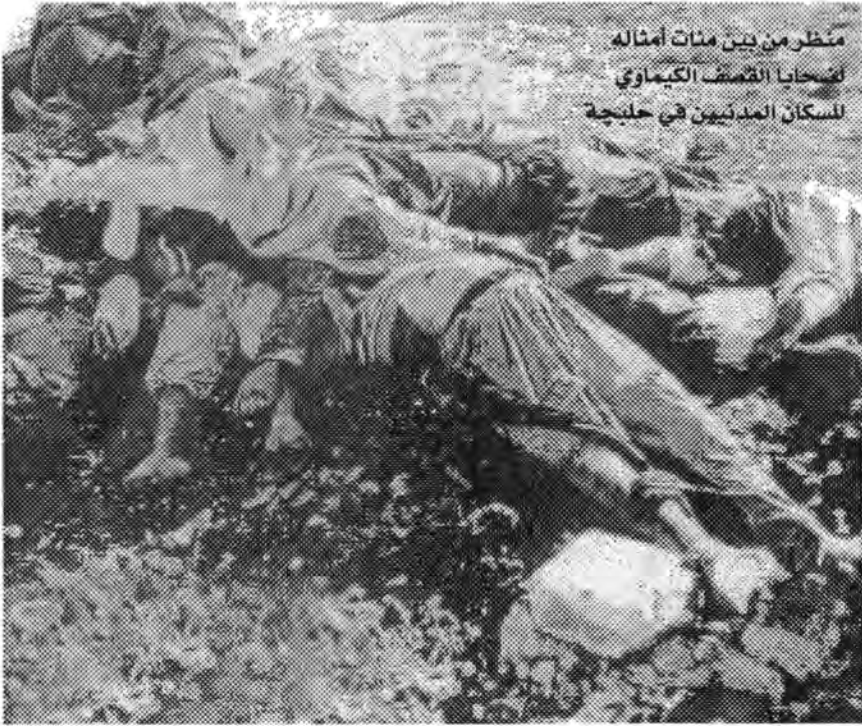
منظر من بين مئات أمثاله لضحايا القصف الكيماوي للسكان المدنيين في حلبجة

ليس من الحق كل الحق وحسب الشرائع السماوية المختلفة والوضع الدولية والضمير والإنصاف مقاضاة كل من تسبب بهذا المصير لهؤلاء الأبرياء من المدنيين العزل؟