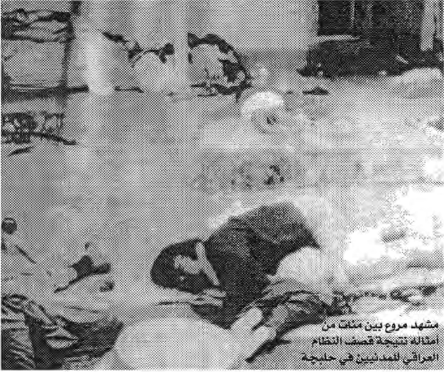
مشهد مروع بين منات من أمثاله نتيجة قصف النظام العراقي للمدنيين في حلبجة

ليتصور كل إنسان هذا المصير له ولأهله وبني قومه ولأي إنسان أعزل مدني آخر في هذا الكون وليحكم من خلال هذا التصور على الفاعلين ومن ورائهم