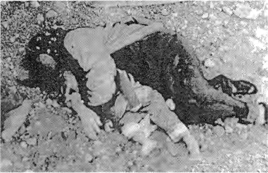
منظر من بين منات أمثاله لضحايا القصف الكيماوي للسكان المدنيين في حلبجة

ليتصور كل إنسان هذا المصير له ولأهله وبني قومه ولأي إنسان أعزل مدني آخر في هذا الكون وليحكم من خلال هذا التصور على الفاعلين ومن ورائهم