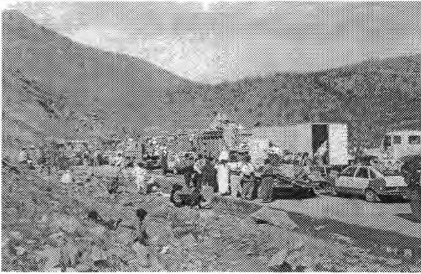
لقطة من آلاف غيرها توضح الرفض الجماهيري الكوردي الواسع للعودة لسيطرة النظام العراقي، اذ يهربون باتجاه حدود إيران بعد اخماد انتفاضة عام ١٩٩١