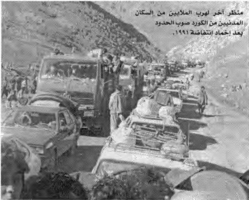
منظر آخر لهرب الملايين من السكان المدنيين من الكورد صوب الحدود بعد اخماد انتفاضة ١٩٩١.