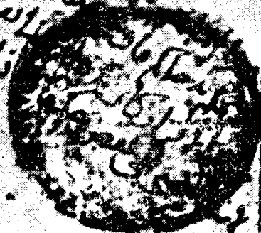
صورة طرة الأصل الخطي لكتاب النكت المحفوظ بدار الكتب المصرية