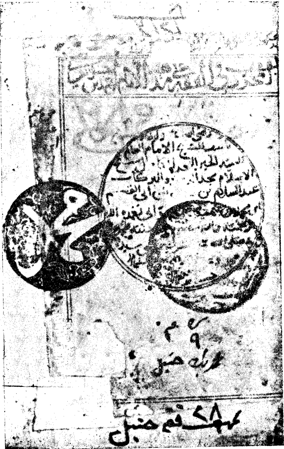
صورة طرة الأصل الخطي لكتاب المحرر المحفوظ بدار الكتب المصرية