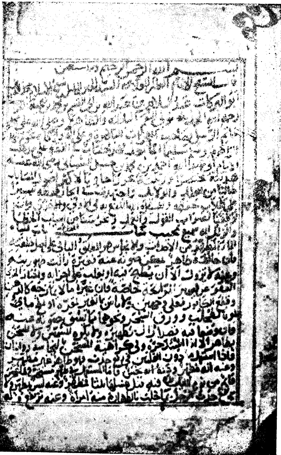
صورة الصفحة الأولى من الأصل الخطي لكتاب المحرر