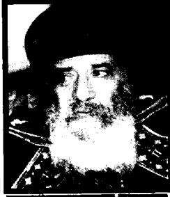
زعيم الأرثوذكس في مصر