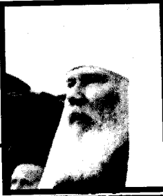
زعيم الأرثوذكس الروس