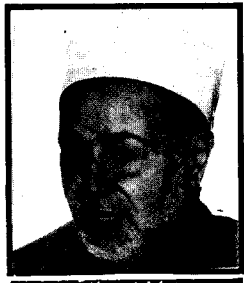
شيخ الجامع الأزهر

● إن المجازر الوحشية التي يرتكبها الصرب الأرثوذكس ضد مسلمي البوسنة والهرسك تتناقضها كل وسائل الإعلام وتسمعها كل الأذان . وهي مجازر هجبية بربرية تشير كل من يمتلك ذرة من الإنسانية أو يخفق قلبه بأي محبة من أي نوع كانت.. ورغم كل هذا .. فقد التزمت الكنائس الأرثوذكسية الصمت وآثرت التجاهل. وفضلت أن تغض الطرف.. رغم أن أبسط ما يوجب الفطرة السليمة هو الاستنكار.. ولن نقول السعي لابقاف سيل الدماء.. ولكنها التزمت الصمت المريب الذي نستشف منه ونستشعر الفرح الخفي والابتهاج الداخلي لما يحدث للمسلمين من مذابح ومجازر على أيدي أتباعها في العقيدة..