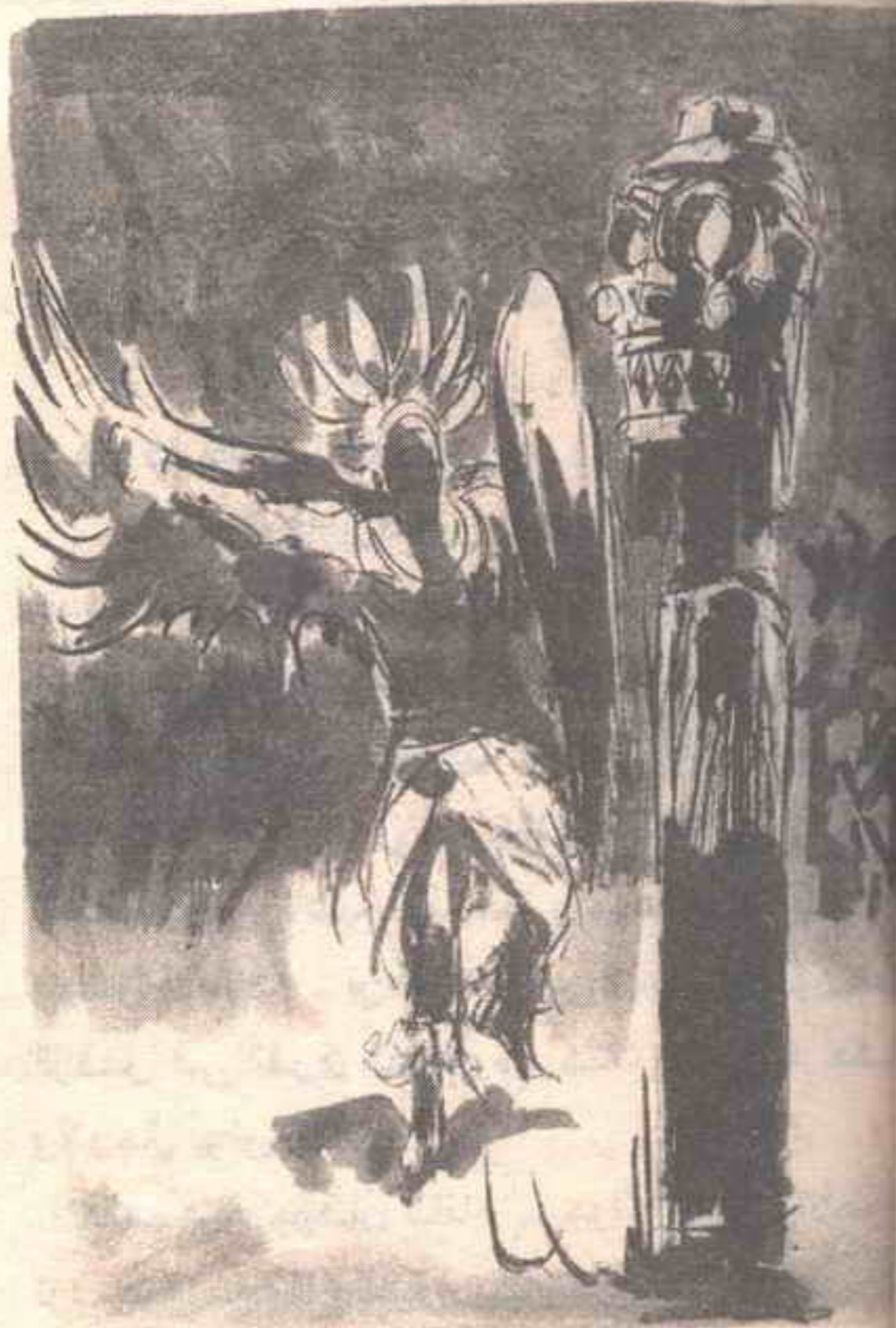
كان هناك ساحر يرقص ، وعلى رأسه قناع يمثل وجهًا باكيًا كأقنعة تمثيل الإغريق ..

كان هناك ( طوطم ) صغير الحجم في مركز الاحتفال ، لم نلاحظ وجوده لدى وصولنا .. وكان ككل الطواطم الإفريقية ، عبارة عن جذع شجرة ، نحتت عليه وجوه بشعة ، لكنها متقنة جدًا من الناحية التشكيلية ، وقد تم تلوينه بتلك الألوان الإفريقية الزاهية المنفرة ، والتي تجعلني أشك في اختلاف تركيب عيونهم عن عيوننا ..