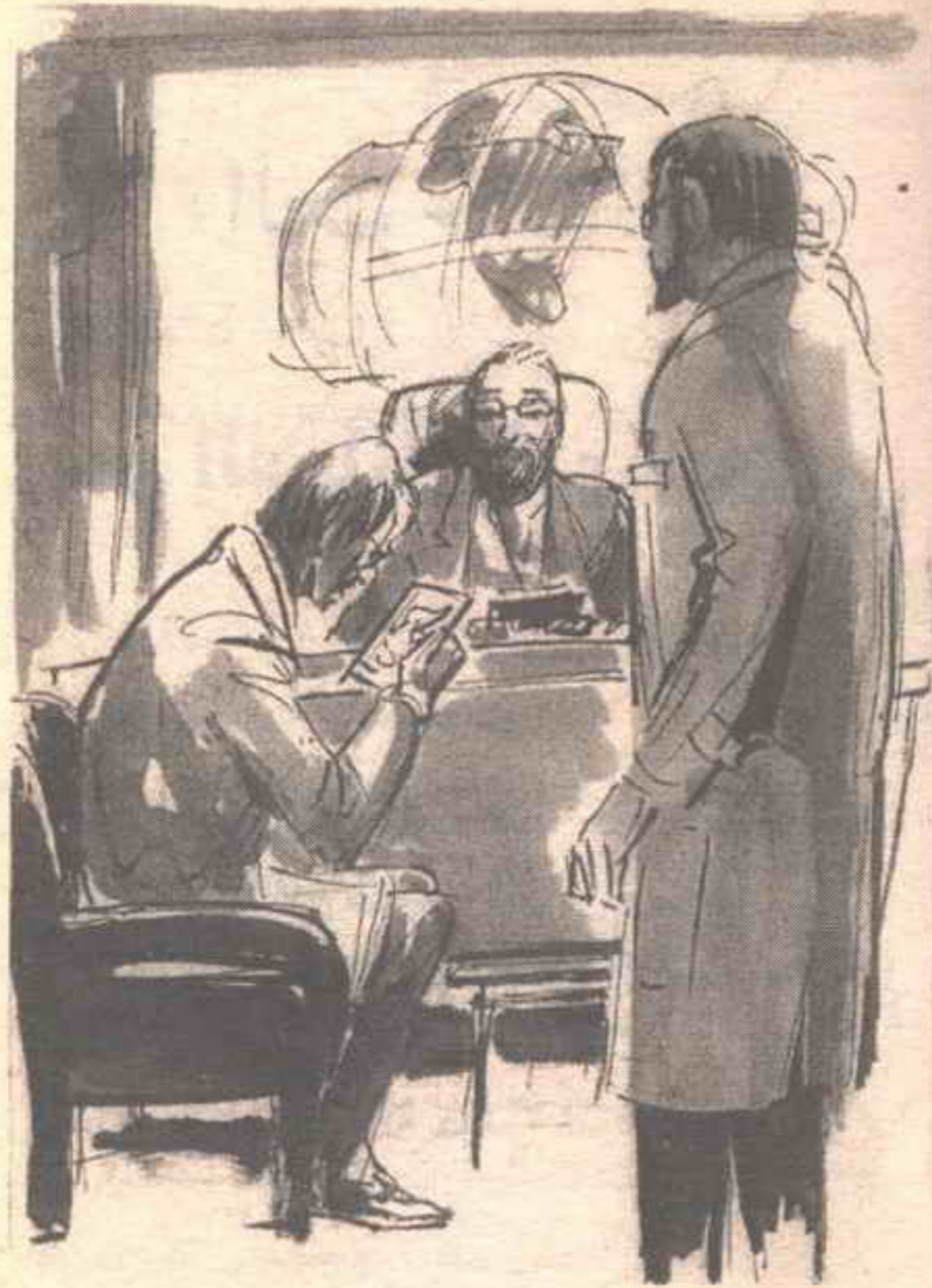
كان هذا الأخير يحمل صوراً فوتوغرافية .. صوراً تم التقاطها من تحت المجهر ..