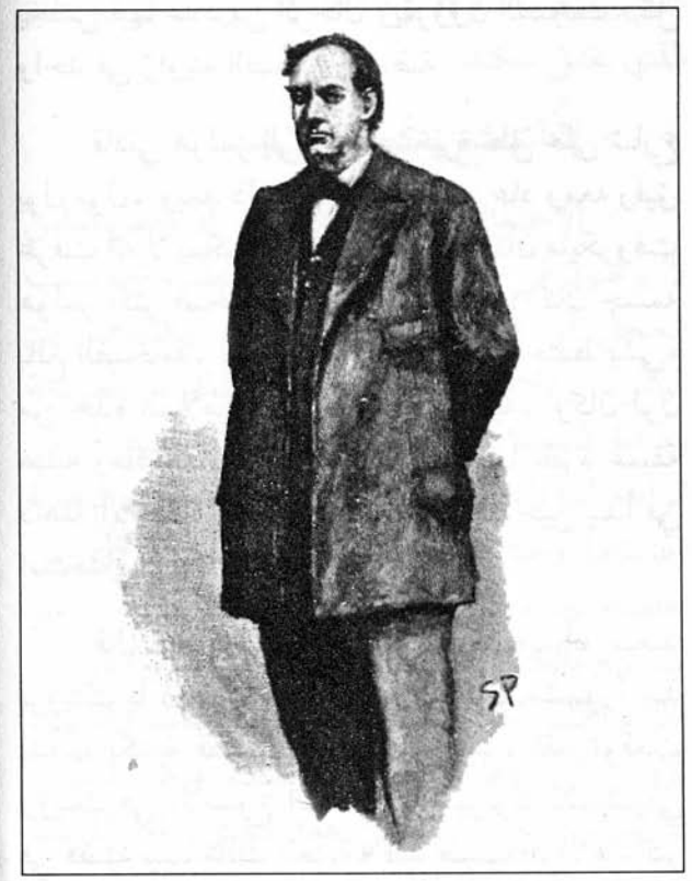
Sydney Paget 1893