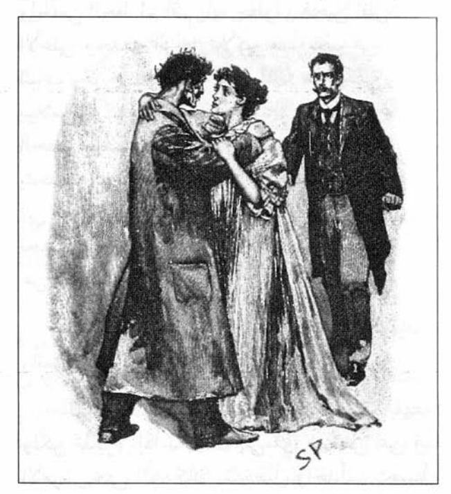
Sydney Paget 1893

وأسرع مندفعاً بين ذراعَي المرأة، ولكن عناقهما استمرّ للحظة فقط حيث أمسك الرجل