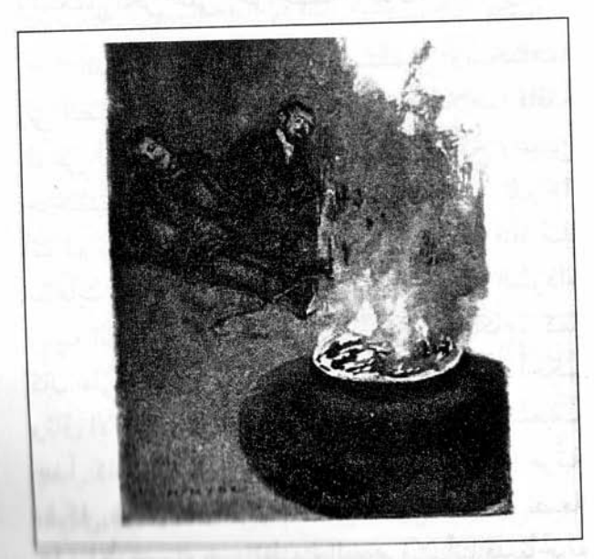
رسم و هـ هايد ١٨٩٣

وحين اختلسنا النظر إلى داخل الغرفة استطعنا رؤية أن الضوء الوحيد الموجود في الغرفة جاء من شعلة زرقاء ضعيفة تومض في مرجل نحاسيّ ثلاثي القوائم في منتصف الغرفة، حيث ألقت بدائرة من الضوء الأزرق الغريب على الأرض، في حين رأينا في الظلّ طيفاً غير واضح لرجلين جاثمين على الجدار!