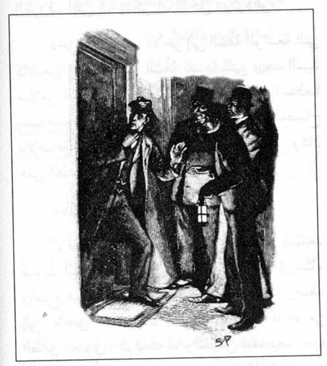
Sydney Paget 1893

واجهتنا ثلاثة أبواب في الطابق الثاني، وكانت الأصوات المنذرة بالشرّ تصدر من الغرفة الوسطى حيث تنخفض في بعض الأوقات لتصبح همهمة ضعيفة ثم يرتفع الأنين ثانية. كانت الغرفة مقفلة ولكن المفتاح كان موجوداً في الباب من الخارج، ففتح هولمز الباب واندفع إلى داخل الغرفة، ولكنه