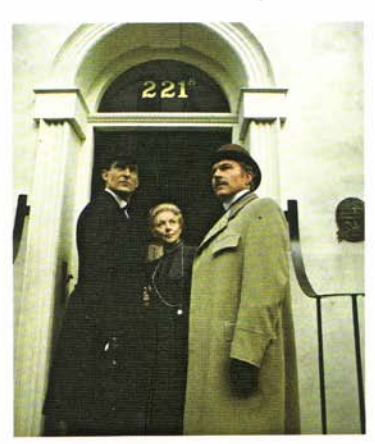
The Adventure of the Greek Interpreter