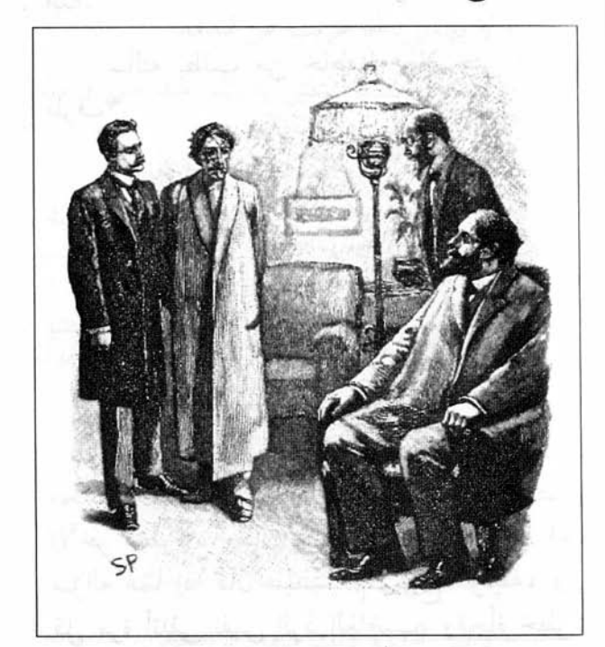
Sydney Paget 1893

صاح الرجل الأكبر سناً عندما سقط هذا الغريب