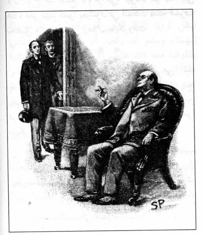
Sydney Paget 1893