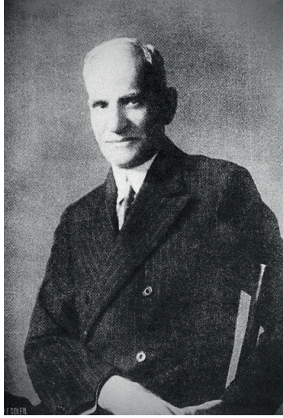
حضرة صاحب السعادة أسعد باسيلي باشا.