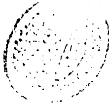
صورة عنوان الرسالة