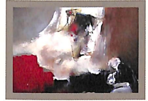
دراسات فكرية (٤)