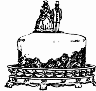
• كعكة الزفاف

- سأشرب أكوابا من الشاي الليلية أكثر من تاكلتون العجوز • وبدا يأكل قطعة من اللحم البارد ثم أضاف :