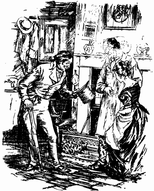
الغريب يقابل متعهد النقل وزوجته .

نظر متعهد النقل اليه ثم تبادل النظرات مع زوجته ورفع الغريب رأسه وأخذ ينظر الى كل منهما على حدة ثم قال :