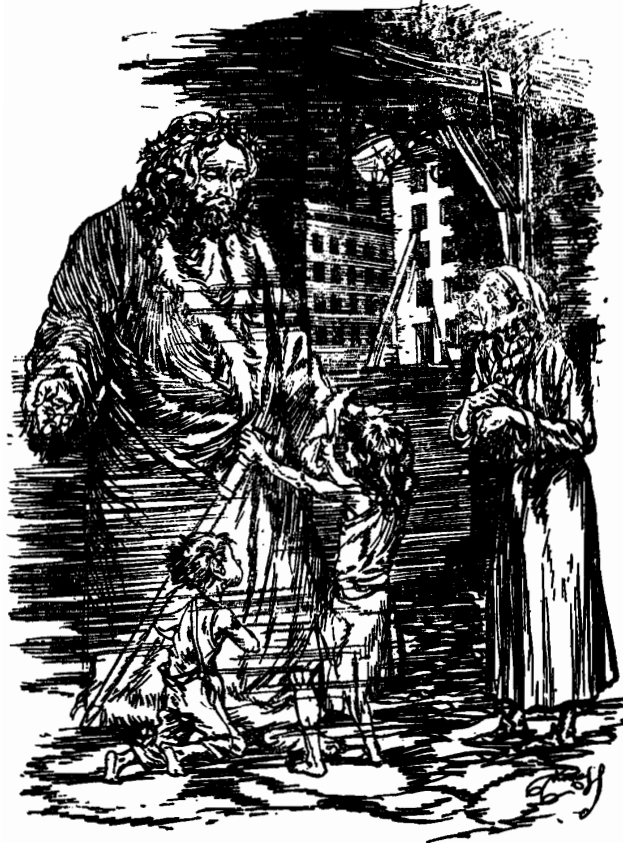
• واحضرت الروح طفلين فقيرين •

- حياتى على هذه الارض قصيرة جدا • انها تنتهى الليلة •