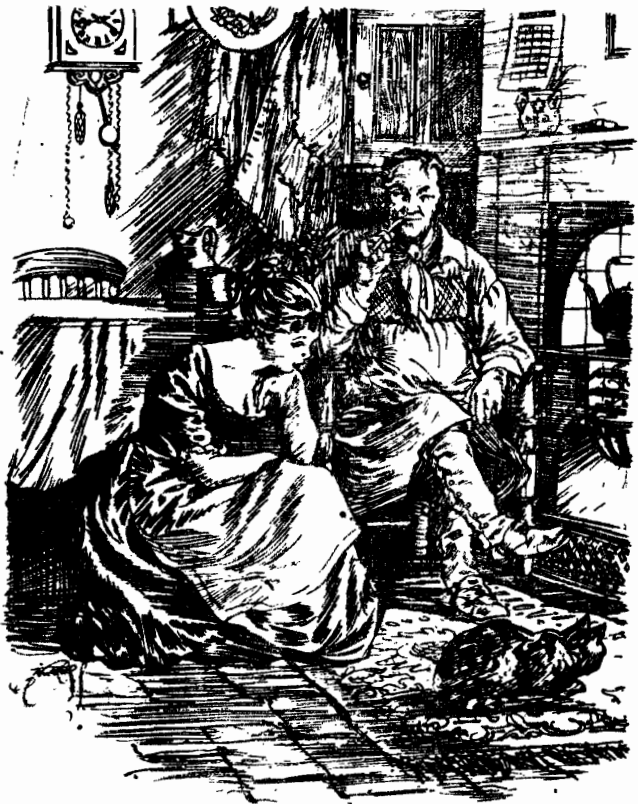
• كانت نقطة تجلس دائما على المقعد الصغير •

بشكل غريب • ولم يكن يقصد أن يربط بين ما قد قاله تاكلتون ومسلك زوجته غير العادى ، ومع ذلك خطر الأمران فى عقله سويا ولم يستطع أن يفصلهما عن بعضهما •