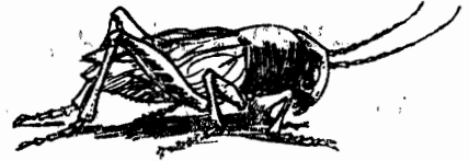
فرقع لوز .

ملات مسز بيريينجل الغلاية من برميل الماء ، ثم وضعتها على النار . كانت أمسية باردة ، وكان الماء في البرميل باردا ولم تحب الغلاية أن يوضع ماء بارد