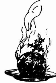
• فطيرة عيد الميلاد •