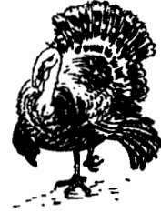
بيك رومى ممتاز .

– سابعث به الى منزل بوب كراتشيت . ولن يعرف من بعث به . انه فى ضعف حجم تاينى تيم !