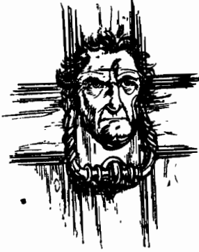
« سقاطة » الباب على شكل وجه انسان

كانت هناك « سقاطة » دقاقة كبيرة على الباب ، وكانت مصنوعة على شكل وجه انسان • وعندما جاء سكروج الى الباب وأوشك أن يفتحه ، تطلع الى الدقاقة