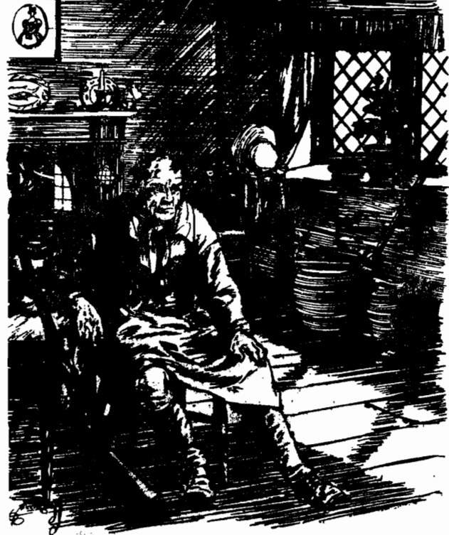
وحلىس متعود النقا. حاننا بعمار الحاننا