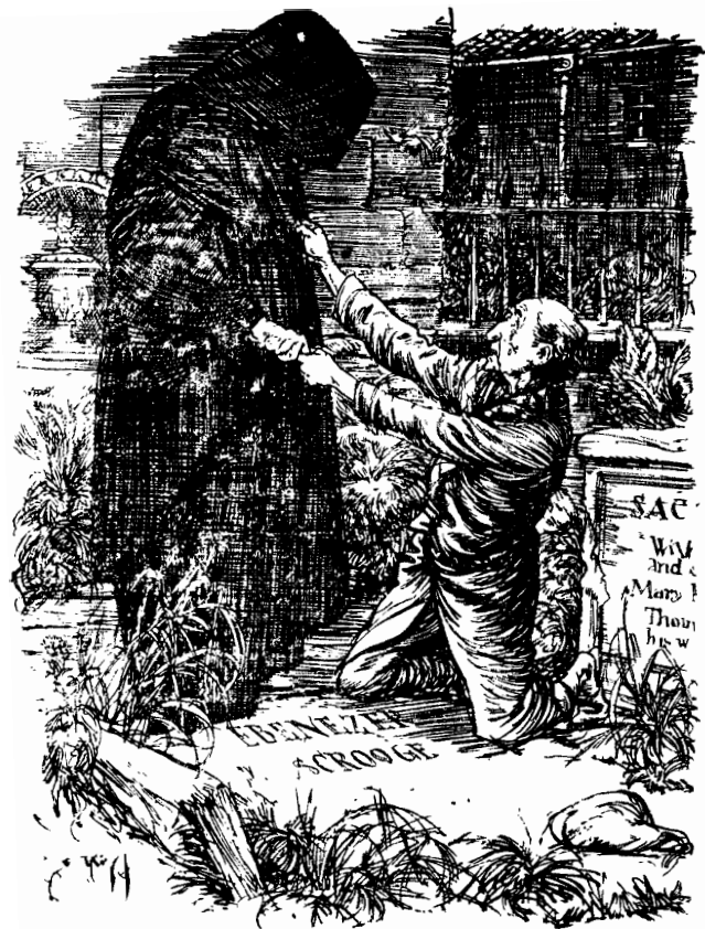
• وقراً سكروج اسمه على شاهد القبر •