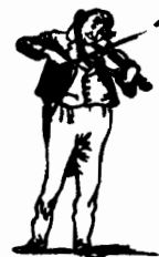
• عازف الكمان

– هل كان يستحق كل هذا المدح ؟ انه انفق جنيهاً قليلة . . . هذا كل ما فى الأمر .