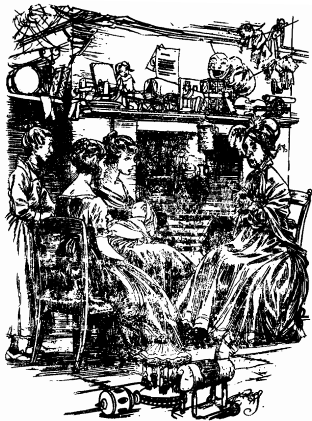
وتكلت ام ماي فيلدينج .

كان أثر هذا الحديث انهم اعطوا جميعا وبسرعة انتباههم الى الطعام الموضوع على المائدة . ملاجون بيربينجل الكنوس ونادى عليهم ليشرّبوا في صحبة تاكلتون وماي وسعادتهما المستقبلية قبل ان يقوم بمرحلته .