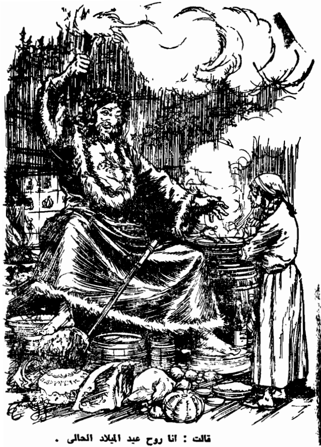
• قالت : أنا روح عيد الميلاد الحالى .

وعندما لمست يد سكروج الباب نادى عليه صوت غريب بالاسم • وتطلع فى الحجرة • كانت حجراته ، لكن مختلفة تماما • كانت الصدران مغطاة بنباتات خضراء مزهرة • وكانت هناك نار كبيرة تشتعل ، وكان على الأرض أكوام من كل أنواع اطعمة عيد الميلاد ••• الديوك الرومى السمينه المعدة للطهى ، وفاكهة ، وحلويات ، وكحك كل شيء !