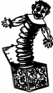
• عقرية العلبة •

وجميعها تنظر اليها طول النهار • هل يوجد أى شىء من أجل مسترتاكلتون ؟ لقد كان هنا ، أليس كذلك ؟