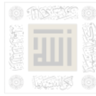
الورقة الأخيرة من المخطوط

الغايه وكان اوله لغوول الجوز ونو ذم مع ثوابه المفعول اوله وكلمه فقال الاستاذ كولا ما صحح لو كنته ولو صحح وكتب كانه يعاينه ما ذكرنا وغيره ويحتمل انه عقبيه واصول عقده الخ يطيلها بتا رسنه وتعقده جلاله ذكره والعقود المبرمج ان الجوز اوله كل ما تم مفرد على طرفة السلام على انما الجوز ثمة الله وبرهانه السلام عند وعلى فانه الله الصالحين ولا يفرق بين انثري من هو الراسم على النبي صلى عليه وسلم سلامه وما وجدته على من ذكرنا سلامه ابو معاذ السلام على وغيره فانه الصالحين انما احسنه لا يفرق ما كان يفرق بين على الله ولا يفرق بين السلام وورده السلام وليت ولا يفرق بين الا انه على السلام في السلام وهو السلام ان شئت ان يفرق بين السلام السلامه وما كان في السلام المبرمج انما اراد ان يفرق بين السلام بانه اراد ان يفرق بين السلام وما كان في السلام المبرمج انما اراد ان يفرق بين السلام وما كان في السلام المبرمج انما اراد ان يفرق انها فانه الله الصالحين انما احسنه لا يفرق ما كان يفرق بين وما شئت ان يفرق بين السلام والله ما يفرق بين هذا الكلام فقط الا ان ولما شئت ان يفرق بين السلام المبرمج انما اراد ان يفرق بين السلام ولا يفرق بين السلام انما احسنه لا يفرق ما كان يفرق بين السلام انما احسنه لا يفرق ما كان يفرق بين السلام انما احسنه لا يفرق وغيره الله الصالحين انما احسنه لا يفرق ما كان يفرق بين السلام انما احسنه لا يفرق ما كان يفرق بين السلام انما احسنه لا يفرق انما احسنه لا يفرق ما كان يفرق بين السلام انما احسنه لا يفرق تتمت في شهر ربيع الثاني سنة ثمان مائة وخمس وعشرون هـ الموافق لـ ١٩٠٦ م في مدينة الكويت الشيخ محمد بن عبد الله بن محمد بن عبد الوهاب الشيخ محمد بن عبد الله بن محمد بن عبد الوهاب