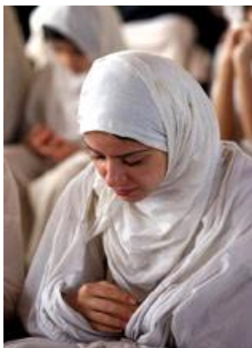
فتاة مندائية تؤدي الصلاة

الصلاة واجبة عليهم يؤدونها في اليوم ثلاث مرات، قبل طلوع الشمس، وعند زوالها، وقبل الغروب، وتُفضل الصلاة جماعة أيام الأحاد وفي الأعياد، وهي تقتصر على الوقوف والركوع والجلوس على الأرض دون سجود.