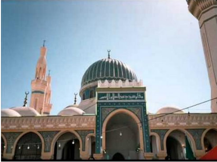
ضريح الشيخ سيدي عبد السلام الأسمر الفيتوري