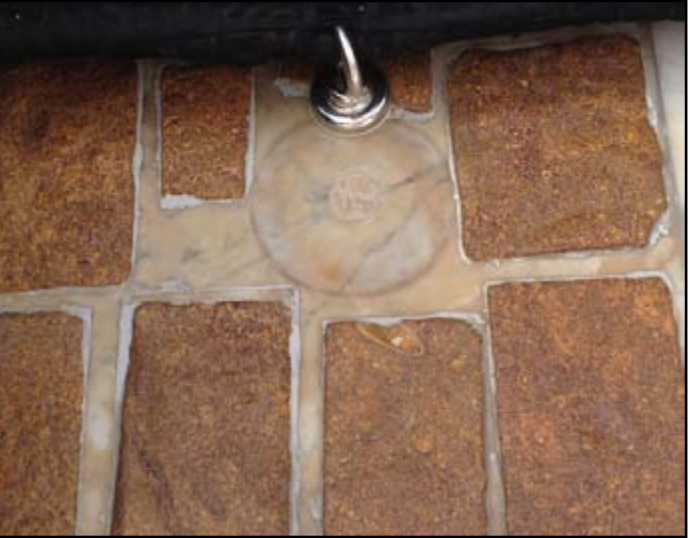
المعجن ( صورة للبلطات الثمان بشاذروان الكعبة المشرفة )

هو حفرة صغيرة كانت لصق جدار الكعبة المشرفة من الجهة الشرقية بين باب الكعبة وركن الكعبة العراقي وطولها متران وعرضها ١٢ سم وعمقها ٢٨ سم, يقال انها علامة موضع مقام ابراهيم عليه الصلاة والسلام , وهي ايضاً علامة مصلى الرسول ﷺ يوم فتح مكة بعد خروجه من الكعبة المشرفة, وهي مصلى جبريل عليه السلام , واما ما ذكره بعض المؤرخين من انها مكان عجن اسماعيل عليه السلام الطين لبناء البيت فهو مستبعد لكون البيت بني