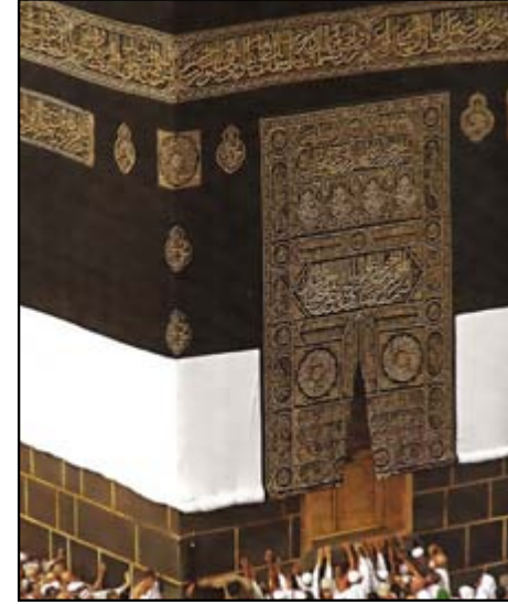
الملتزم (اعتاب الملك)