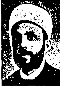
الشيخ أحمد طباره