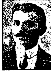
الأمير عارف الشهابي