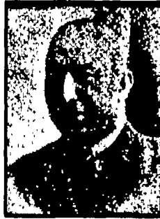
على جودة الأيوبى