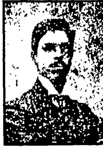
سيف الدين الخطيب