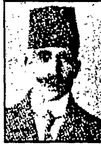
عبد النهاب الإنكليزى