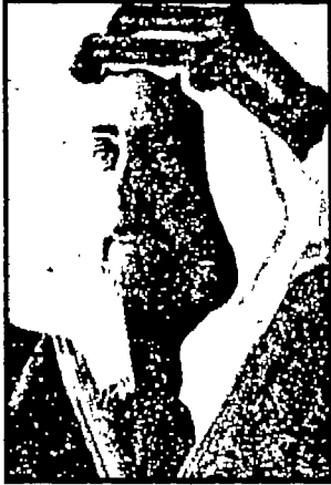
الأمير عبد الله